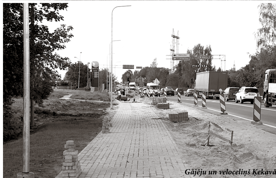
Gājēju un velociņš Ķekavā

attīstībai – 57 378 eiro, Lauku attīstības programmas pasākuma „Infrastruktūra, kas attiecas uz lauksaimniecības un mežsaimniecības attīstību un pielāgošanu” aktivitātes „Meliorācijas sistēmu rekonstrukcija un renovācija” ietvaros.