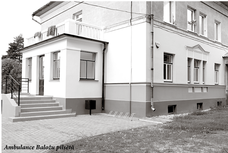
Ambulance Baložu pilsētā