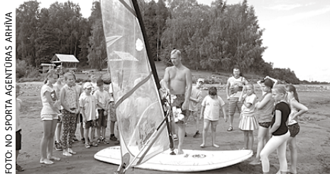
Nometnes ietvaros aktivitātes notika arī ūdenssporta klubā „Kambīze”.