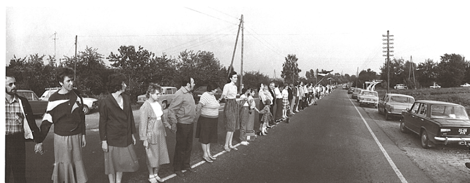
Baltijas ceļš 1989. gada 23. augustā Ķekavā.

Šogad atzīmējam akcijas „Baltijas ceļš” 25. gadadienu, kad 1989. gada 23. augustā pulksten 19 divi miljoni cilvēku, sadevušies rokās 15 minūtes, veidoja aptuveni 600 km garu dzīvo ķēdi, kas savienoja Baltijas valstu galvaspilsētas – Tallinu, Rīgu un Viļņu.