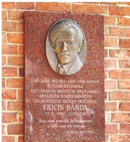
Piemīņas plāksnes atklāšana dzejniekam Frīcim Bārdam.

Jubilejas piektajā dienā, 22. augustā, Katlakalna bibliotēkā tika atklāta izstāde „Ķe-