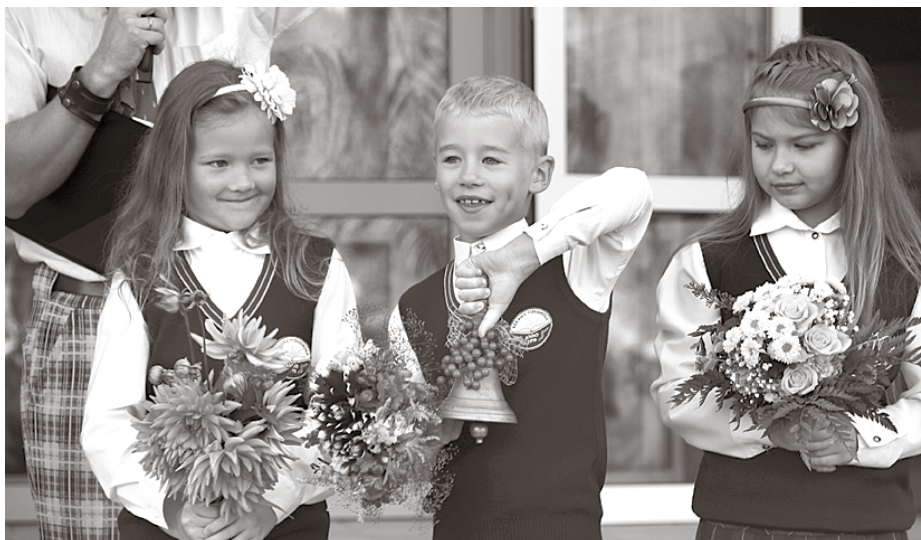
Pirmais skolas zvans Ķekavas sākumskolā

Visnopietnākie darbi šovasar norisinājās Ķekavas vidusskolā, kur nomainīta sporta zāles grīda. Šis remonts bija ļoti nepieciešams un ilgi gaidīts. Iepriekšējais grīdas segums kalpoja jau 39 gadus un bija pamatīgi nolietots. Taču tās nav vienīgās pārvērtības, kas priecēs skolēnus un peda-