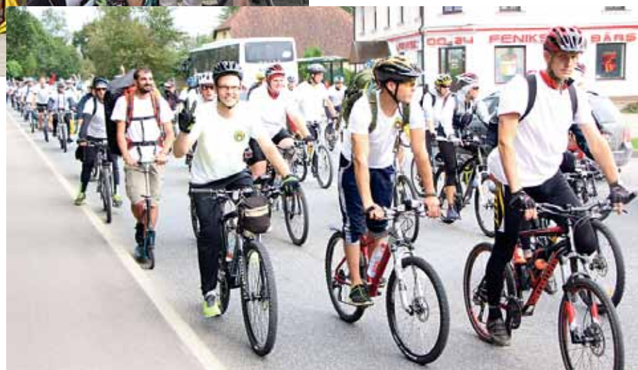
Velobrauciens par godu Baltijas ceļa gadadienai.