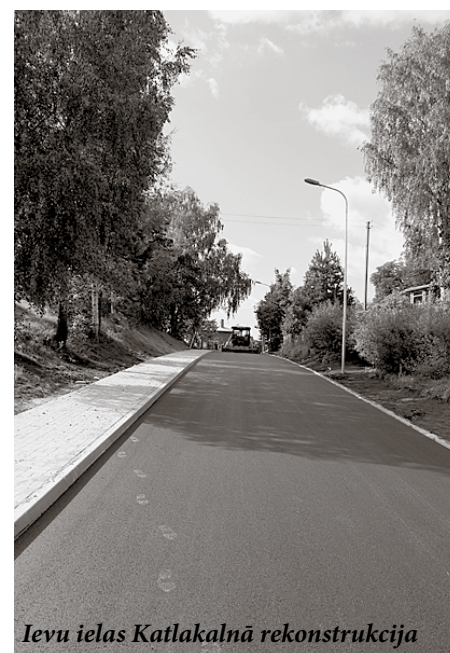
Ievu ielas Katlakalnā rekonstrukcija