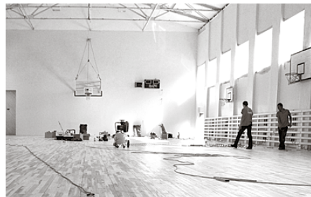
Lielākie remontdarbi veikti Ķekavas vidusskolā.

Tuvākā vai tālākā nākotnē lielākais darbs, kurš būtu veicams, visas 1989.gadā būvētās skolas ēkas siltināšana no ārpuses. Jau šogad bija plānots veikt skolas sporta zāles jumta siltināšanu, bet, veicot ēkas jumta inženier-tehnisko apsekošanu, speciālisti norādīja uz nepieciešamību veikt papildus darbus, kuri nebija paredzēti izstrādātajā projektā un būtiski palielināja izmaksas. Izprotot finanšu situāciju un to, ka papildus līdzekļus šobrīd nav iespējams saņemt, skolas administrācija piedāvāja mainīt darbu kārtību un uzlabot skolēnu sadzīves apstākļus. Novada dome apstiprināja piedāvātos bu-