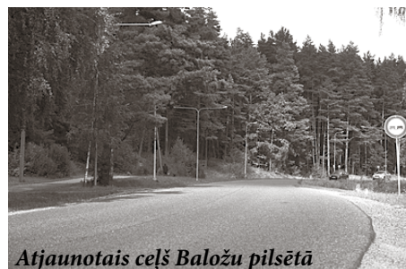
Atjaunotais ceļš Baložu pilsētā

Sadarbībā ar VAS „Latvijas valsts meži” tiek realizēts projekts „Meliorācijas sistēmu „Meža masīvs Ezeri”, „Kraukļu purvs” rekonstrukcija Ķekavas novadā” (Nr. 13-04-L12500-000209). Projekta kopējās izmaksas ir 69 428 eiro, finansējums no Eiropas Lauksaimniecības fonda lauku