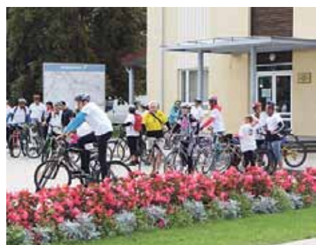
Velobraucienā visa maršruta garumā kopumā piedalījās teju 2000 cilvēku.