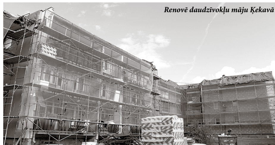
Renovē daudzīvokļu māju Ķekavā