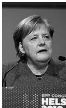
Angela Merkele, Vācijas kanclere