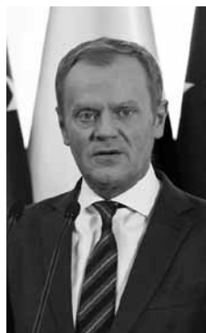
Donalds Tusks, ES Padomes prezidents