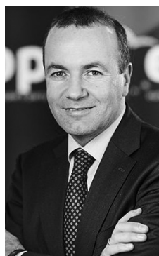
Manfrēds Vēbers, ETP grupas vadītājs Eiropas Parlamentā