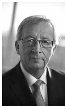
Žans Klods Junkers, Eiropas Komisijas prezidents