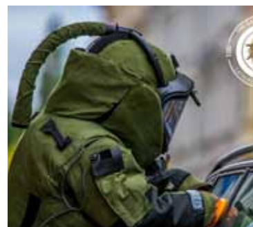
Policijas sapieru bruņu tērps.