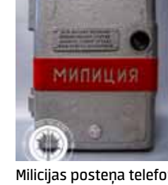
Milicijas posteņa telefons.

Latvijā tiek vāktas rakstiskas un praktiskas liecības, lai izveidotu policijas vēstures muzeju. Kuldīgā tagā būs nozīmīga vieta, jo ieceres īstenošana sakritusi ar to brīdi pirms gada, kad iecirknis