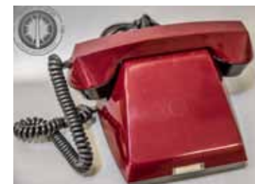
Telefons bez ciparnīcas.