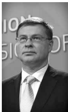
Valdis Dombrovskis, Eiropas Komisijas viceprezidents