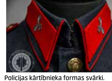
Policijas kārtībasnieka formas svārkī.