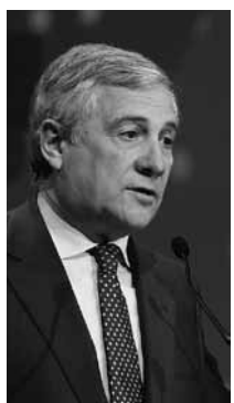
Antonio Tajāni, ETP grupas deputāts un Eiropas Parlamenta prezidents