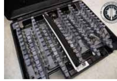
Ceļu policijas ezis.