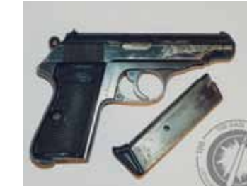
Walther policijas pistole.