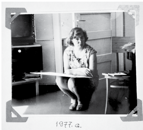
Dzidras darbi apkopotu piecos albumos. Pirmais iesākts 1977. gadā.

rējās, kurš kurā gadā apglabāts, es pierakstīju, skicēju un zīmēju. Tā ir bagātība no mammas dotajām atmiņām.