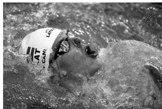
Latvijas čempionātā 2016. gadā.