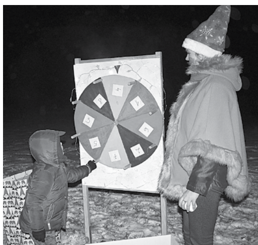
Gan lieli, gan mazi varēja griezt laimes ratu.

Vēl Ziemassvētku gaidīšanas laikā būs vairāki pasākumi. 14. decembrī 16.00 aicināti seniori, bet 15. decembrī 11.00 būs jampadracis Pelčos deklaratīvajam pirmsskolas vecuma bērniem.