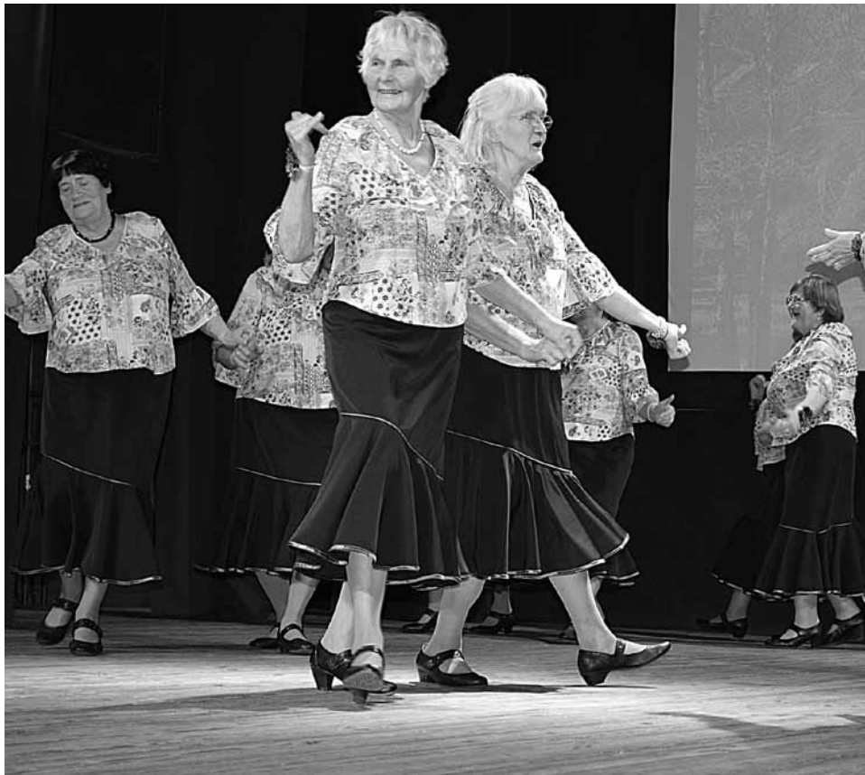
Eiropas deju kopa Madaras no Kuldīgas pensionāru apvienības Rumbiņa projektu konkursā Darīsim paši uzšuvusi skatuves tērpus.

mudināja piedalīties arī nākamgad, kad katrai grupai iecerēts nedaudz lielāks atbalsts.