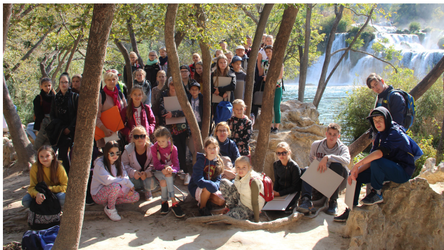
leguvumi – iepazīt krāšņo dabu un atšķirīgu arhitektūru, gūt vērtīgu pieredzi

Horvātijā, nelielā salā līdžās Trogiras pilsētā, pavadījām trīs iespaidiem bagātas dienas.