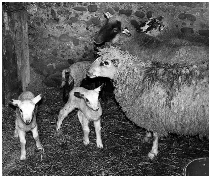
Ap Ziemassvētkiem Snēpeles Pilskaln os ieradusies pirmie trīs jēriņi, bet gaidāmi vēl daudzi.

Vai uz pilsētu nekārojas? „Ilgi pilsētā nevarētu. Tur nevar iziet