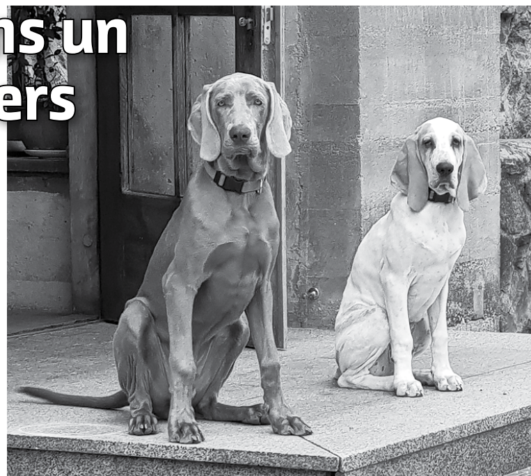
Viesu nama Mazsālijas izcilie saimnieki: veimārietis Džaspers un porcelāns Faraons.