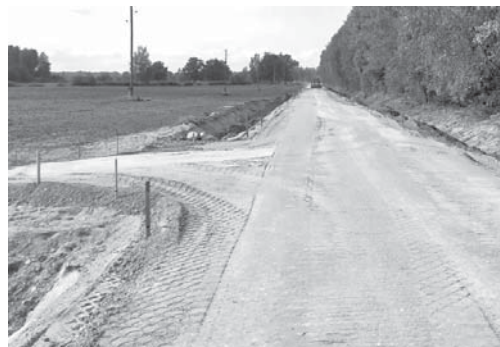
Mežmaļi-Dekšņi; foto: L. Kadžule

grāvju iztīrīšana vai izbūvēšana no jauna, apauguma, kas kavē ūdens noteci, noņemšana, nolietojušos caurteku nomaīna, ceļa zīmju uzstādīšana, kā arī lauksaimniecības tehnikai piemērotu nobrauktuvju uz īpašumiem izbūve. Ceļu būvniecības darbi uzsākti jūlijā un turpinās. Ik mēnesi tiek noturētas sapulces, kurās piedalās būvdarbu vadītāji, būvuzraugs un pašvaldības atbildīgie darbinieki. Tiek plānots, ka objekti tiks nodoti ekspluatācijā 2018.gadā.