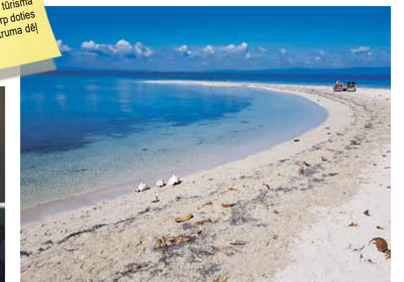
Tik tirkīzzilu krastu kā Karību jūrā pie Kubas neesot nekur citur.