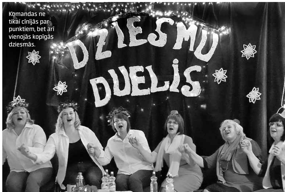
Komandas ne tikai cīnījās par punktiem, bet arī vienotās kopīgās dziesmās.