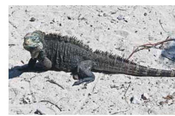
Kubas daba ir neatkārtojama.