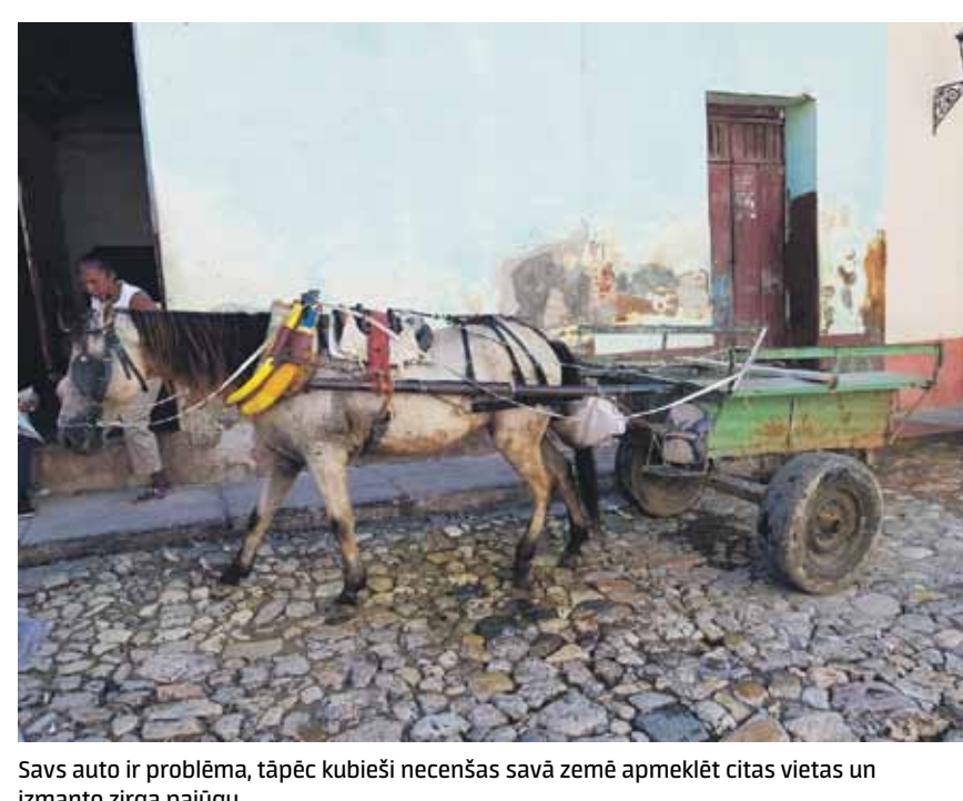
Savs auto ir problēma, tāpēc kubieši necenšas savā zemē apmeklēt citas vietas un izmanto zirga pajūgu.