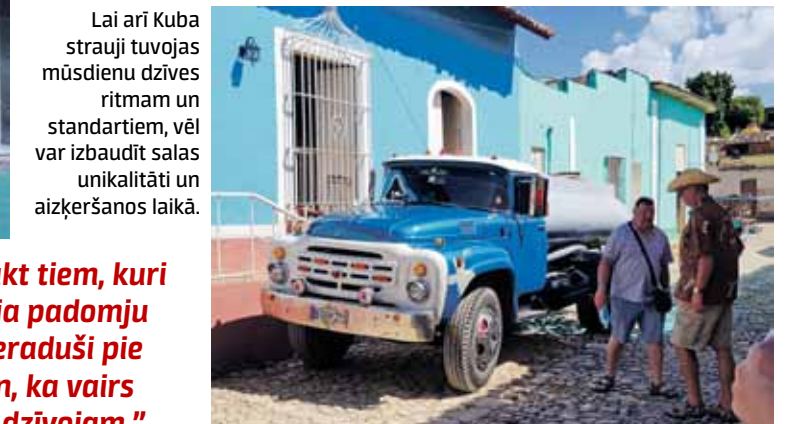
Lai arī Kuba strauji tuvojas mūsdienu dzīves ritmam un standartiem, vēl var izbaudīt salas unikalitāti un aizķeršanos laikā.

„Uz Kubu iesaku aizbraukt tiem, kuri kavējas atmiņās, kā bija padomju laikos. Esam tik ļoti pieraduši pie tā, kas mums ir šodien, ka vairs neapzināmies, cik labi dzīvojam.”