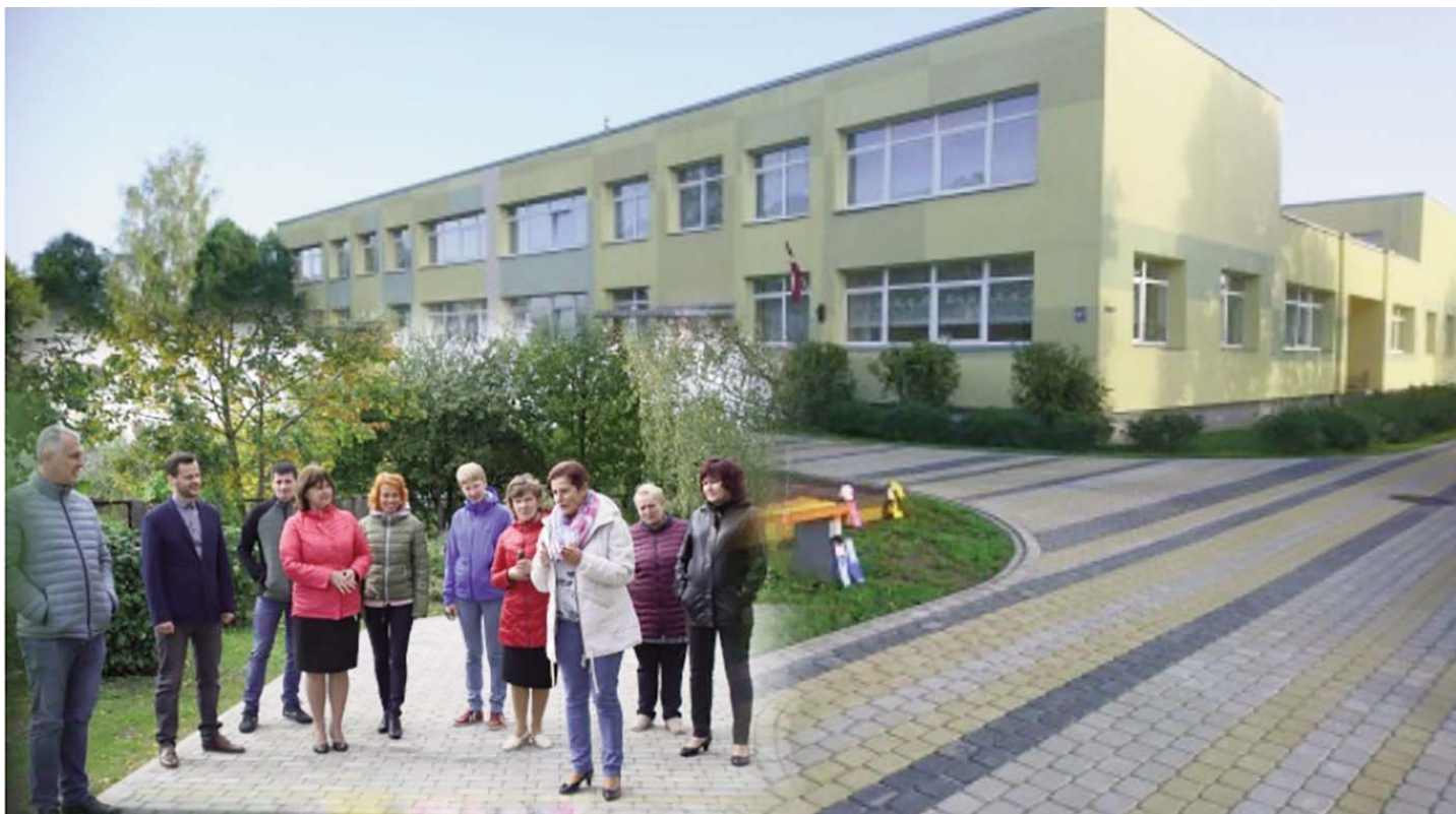
Aknīstē svinīgi atklāj laukumus pie izglītības iestādēm. Turpinājums 5. lpp