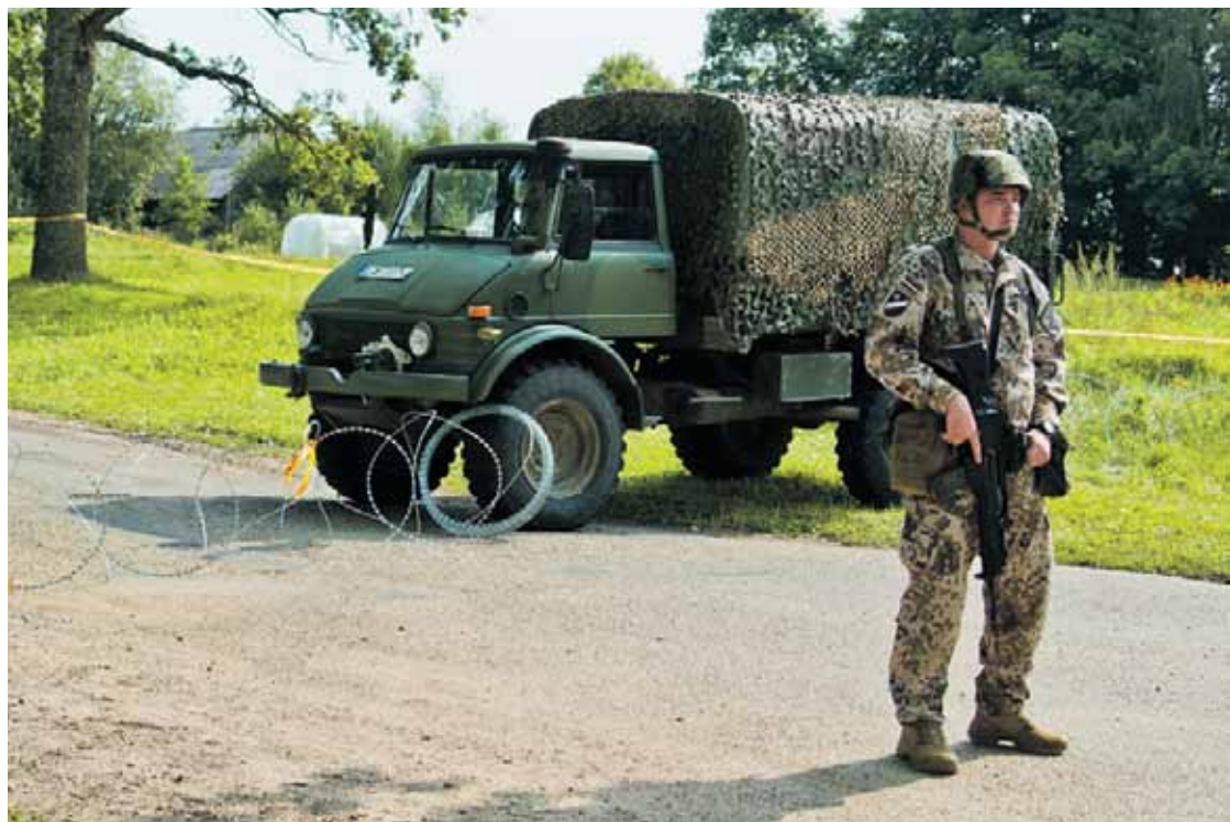
Latvijas armijas pārstāvji norāda, ka sociālie tīkli ir labs instruments, ko izmantot, lai laikus paziņotu sabiedrībai par aktualitātēm, piemēram, militārām mācībām, sniedzot īsu, precīzu informāciju, kā arī lai cilvēki uzzinātu jaunumus no uzticama avota un nerastos baumas.

Aizsardzības ministrija regulāri rīko lekcijas karavīriem un zemessargiem par medijpratības jautājumiem, tai skaitā par situāciju sociālajos tīklos, kur bez viltus ziņām sastopamas arī viltus identitātes, boti, troļļi. Lekcijās “Kā mēs sargājam Latviju?” skolēniem, semināros skolu vadītājiem tiek skaidrots par informācijas telpas drošību, arī par to, kas ir viltus ziņas un