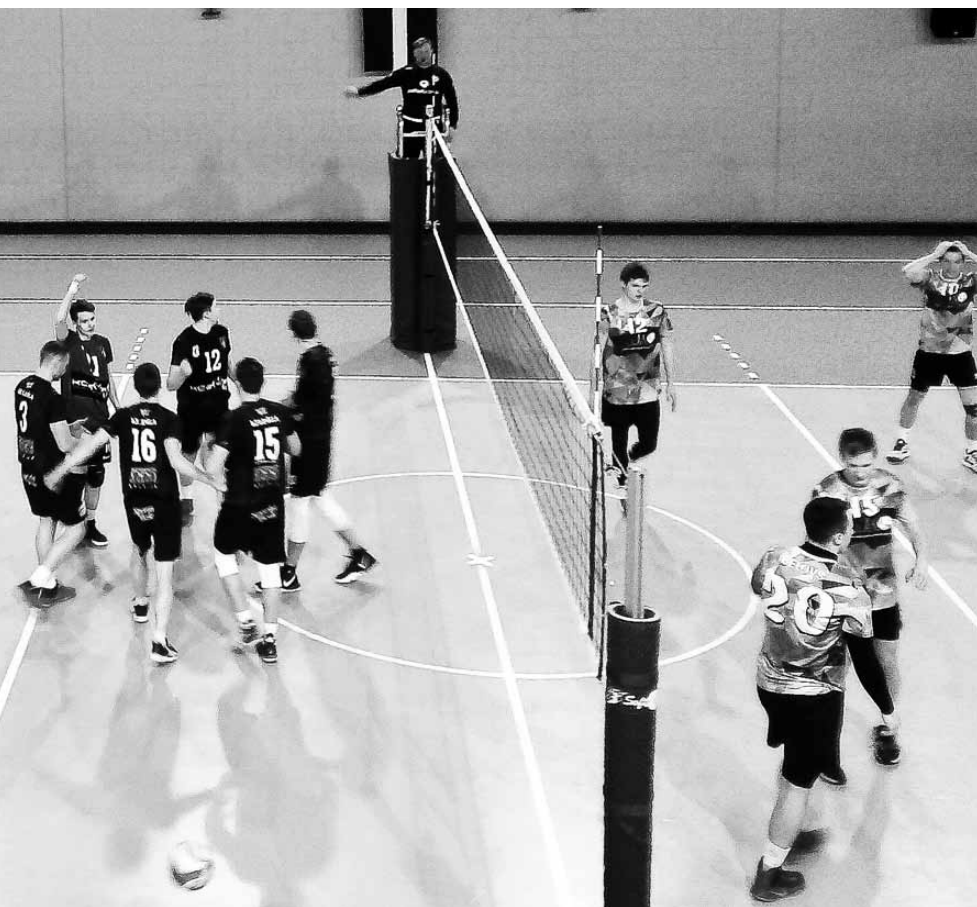
Izšķirošais punksts! Kuldīga pieveic Rīgas volejbola skolu.