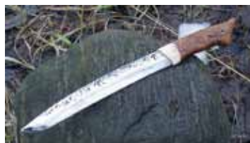
SKRAMASAKS. Ierocis, ko pazīstam kā mačeti, 5.–8. gadsimtā izdomāts Zemgalē, kur to sauca par skramasaku. Tikai pēc tam šādi naži sāka ceļot pa pasauli.