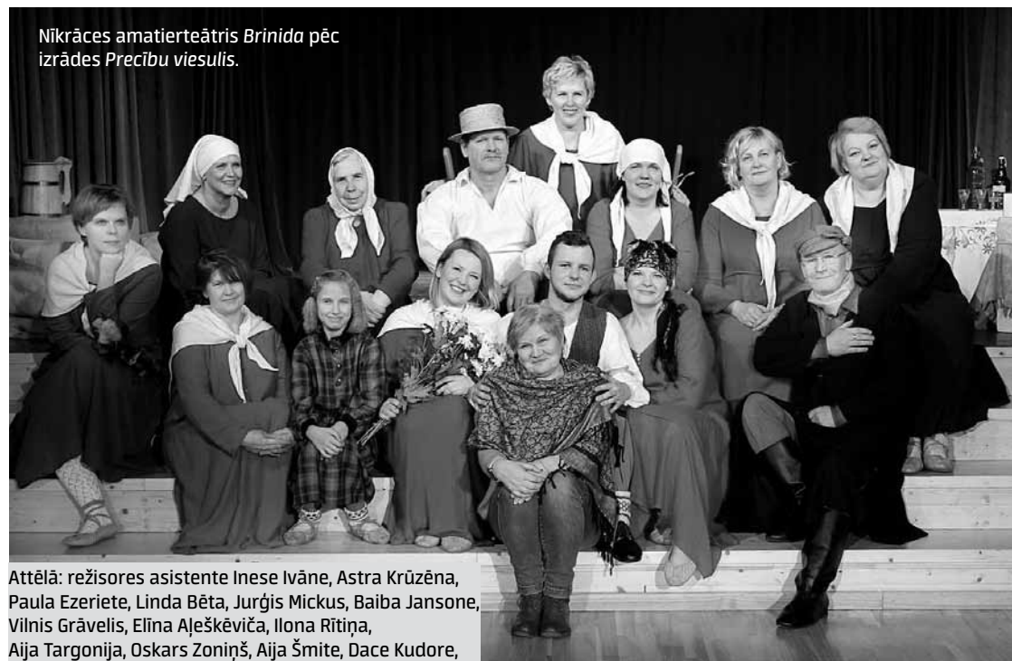
Nīkrāces amatiereteātris Brinida pēc izrādes Precību viesulis .