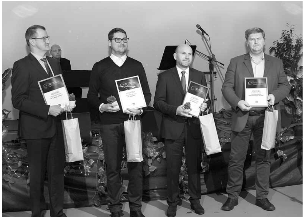
Par lielām investīcijām savās ražotnēs – Kuldīgas novada pašvaldības pateicība uzņēmumiem Latvijas Finieris, Stiga RM, Palleteries un Turlavas zemnieku saimniecībai Ploces.

(Vairāk attēlu par visām kategorijām: www.kurzemnieks.lv .)