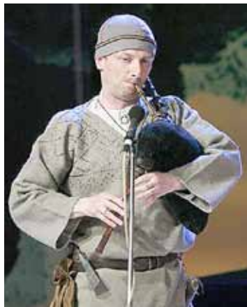
DŪDAS Latvijā spēlētas jau vismaz sešus gadsimtus.