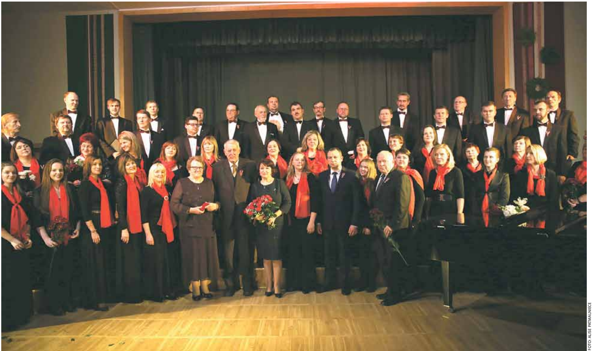
Ķekavas novada Goda pilsoņi kopā ar Ķekavas novada domes vadību, sieviešu kori „Daugaviete” un vīru kori „Ķekava” Ķekavas kultūras namā

ĶEKAVAS ŠĀKUMSKOLAS KĀRTAS 2. KĀRTAS ĀTKLĀŠANA