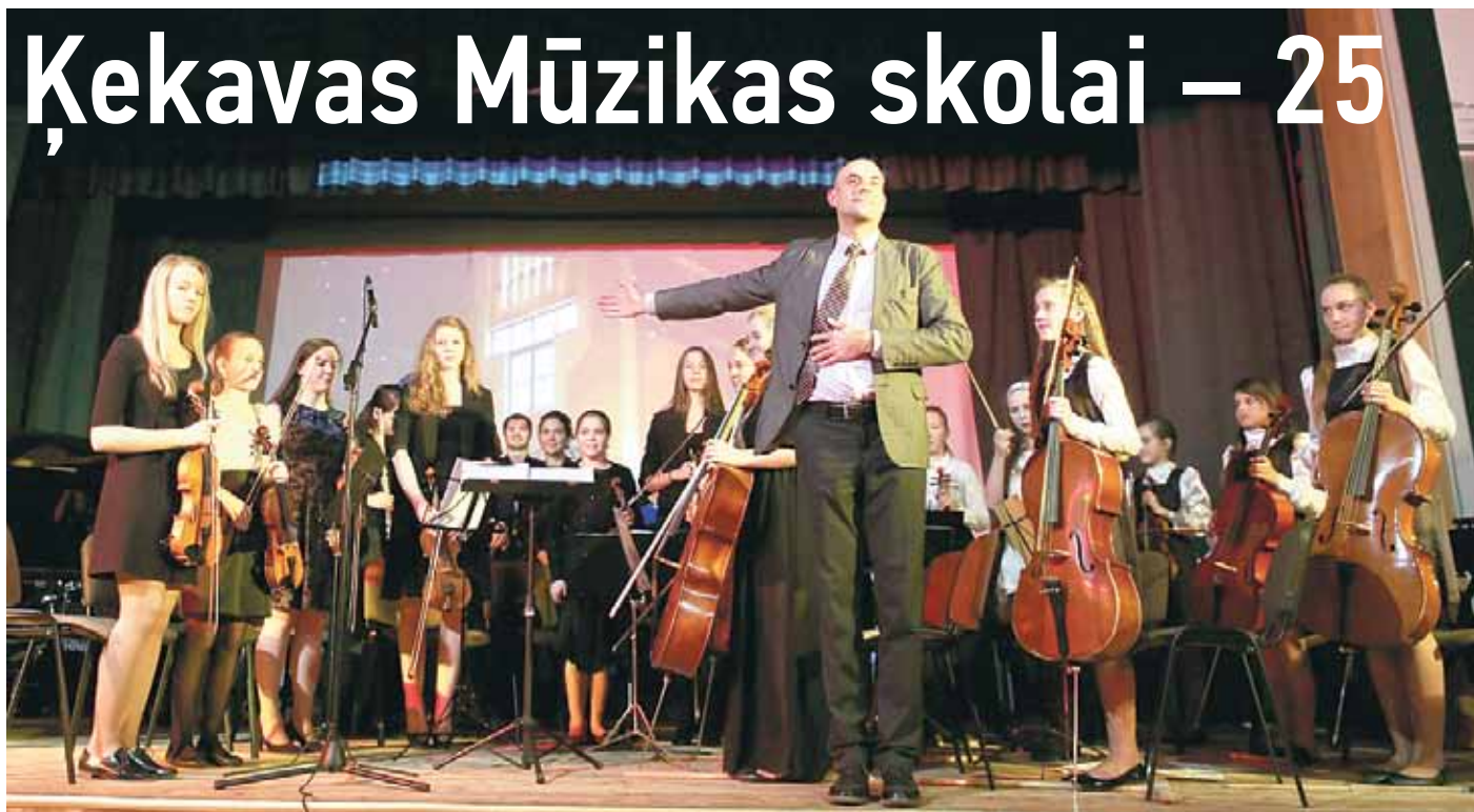
Mirkļis no Ķekavas Mūzikas skolas jubilejas koncerta

Savu jubileju Mūzikas skola atzīmēja 3. decembrī ar koncertu „25. Ziemassvēt-kus gaidot” – ar patiesu svētku noskaņu,