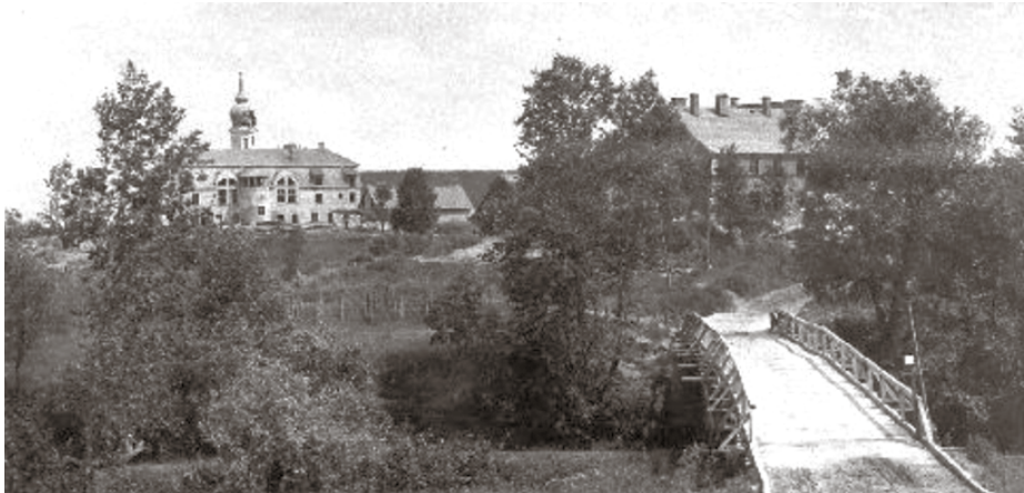
Vēsturisks foto ar Ķekavas „mazo skoliņu”, Doles Tautas namu un baznīcu 1917. gadā. Šo unikālo fotogrāfiju atradis dendrologs Gvido Leiburgs kādā Igaunijas arhīvā.

Parka teritorijā konstatēti arī trīs īpaši aizsargājami dižkoki: divi baltalkšņi un