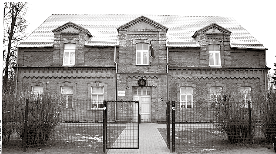
Vecā Ķekavas sākumskola

Šis jautājums deputātu vidū raisīja plašas diskusijas – tika runāts, piemēram, par ēkas tehnisko ekspertīzi, par iespējamajām būvniecības izmaksām, par būvniecības uzsākšanas laiku un finansēm, par telpu nodošanu Mākslas skolai no nākamā gada un daudziem citiem jautājumiem (ar tiem