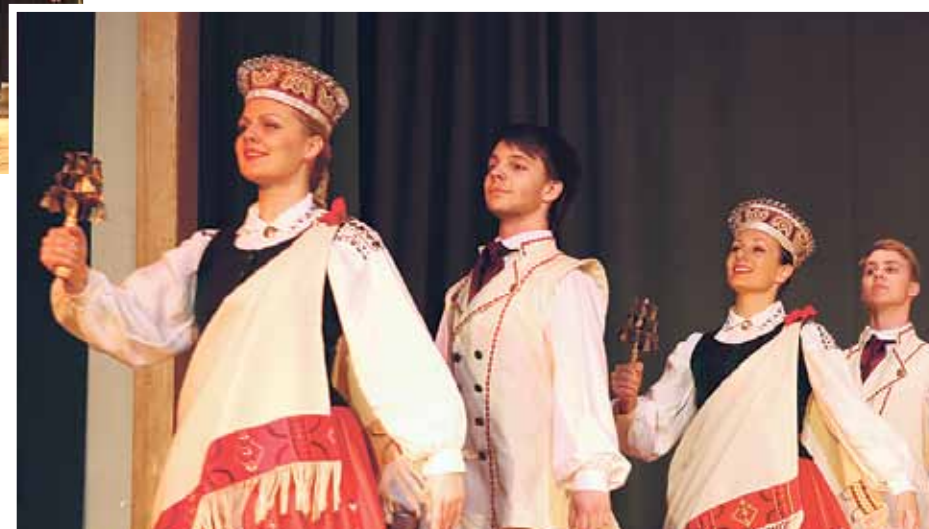
Mirkļi no valsts svētku un Lāčplēša dienas pasākumiem Ķekavas novadā