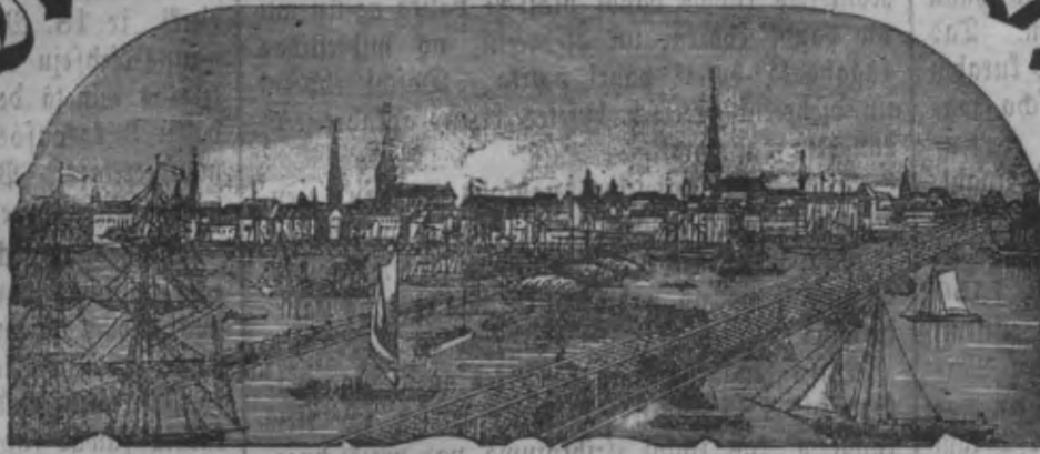
Mahjas weefis isnaht weenreis pa nedetu.

Maksa bes peefubtiščanas Rīgā: Ar peelikumu: par gadu 1 r. 75 l. bes peelikuma: par gadu 1 „ — „ Ar peelikumu: par 1/2 gadu — „ 90 „ bes peelikuma: par 1/2 gadu — „ 55 „