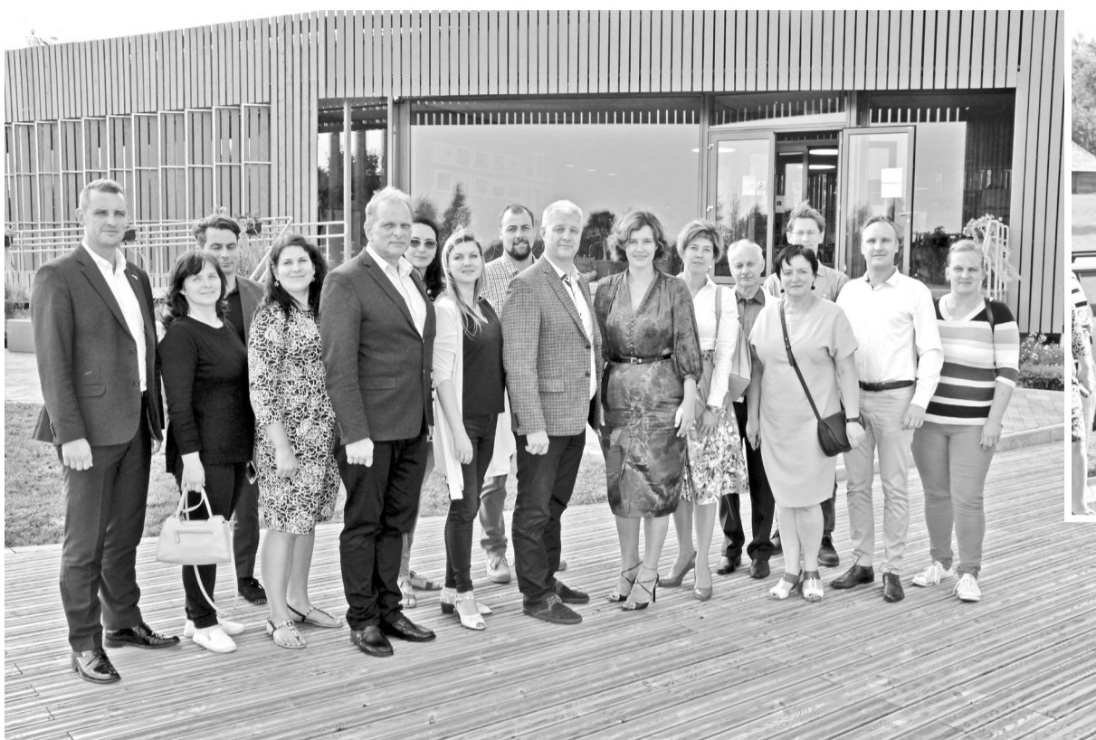
Aļoju un Madonas pašvaldības pārstāvji kopā ar Latvijas Republikas finanšu ministri Danu Reizniecei – Ozolu SALAS pagalmā Ungurpilī.

24. augustā Aļoju novadu apmeklēja Madonas novada pašvaldības vadība un darbinieki. Viņi vēlējas gūt iespaidus Aļoju novada uzņēmējdarbības atbalsta centrā – bibliotēkā „SALA”, jo arī madonieši iecerējuši realizēt līdzīgu ideju par energoefektīvas pašvaldības ēkas būvniecību.