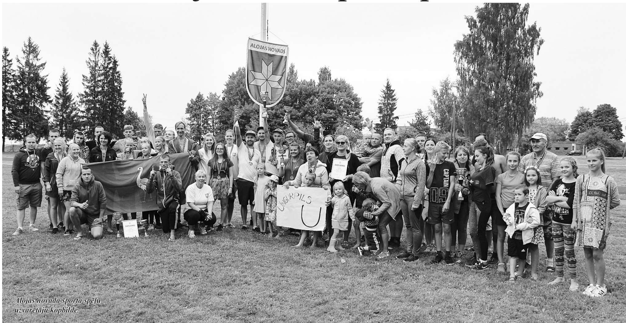
Alojas novada sporta spēļu uzvarētāju kopbilde.

11. augustā Vilzēnu sporta laukumā notika Alojas novada sporta spēles. Dalību sacensībās bija pieteikušas 10 komandas, pārstāvēt visas novada apdzīvotās vietas.