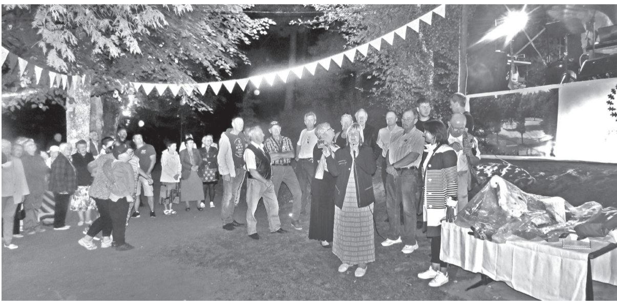
Simtgades Zaļumballe Staiceles parkā šī gada 11. augustā.