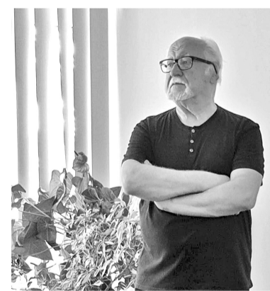
Boņuks viņu nav pazinis.

Paralēli tam režisors atcerējās un uzturināja klausītājus ar stāstu, kā viņš ticis pie mācītāja lomas filmā „Cilvēkā bērns”. Noskatīts bijis aktieris no Lietuvas, bet, gluži prozaiski, nevarēja viņu sazvānīt. Nekas cits neatlika, kā pašam tēlot prāvestu – nodzīt bārdi un pieņemties svārā. Lomā tik ļoti iējuties, ka sākumā pat