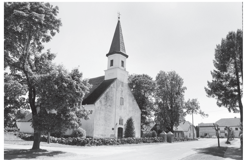
Alojas luterāņu baznīca 2018. gada vasarā..

Luterāņu draudze Alojā pastāv no 1534. gada. Pašreizējā Alojas luterāņu baznīca iesvētīta 1776. gada