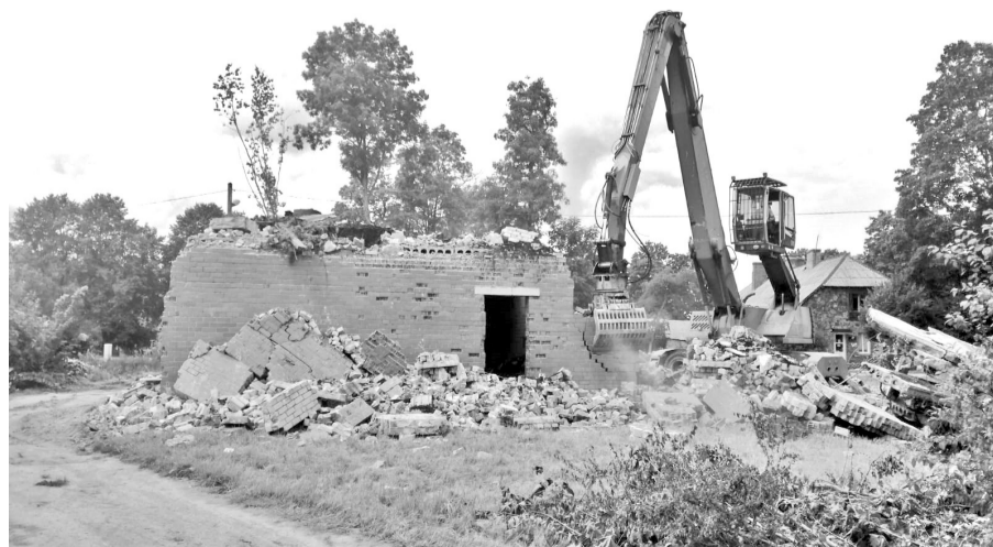
Notiek demontāžas darbi Rīgas ielā 9A, Alojā