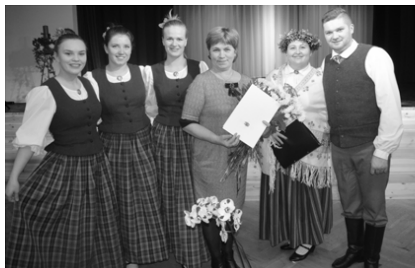
“Kust i kust” kolektīvam Latvijas Nacionālā Kultūras Centra Pateicība par piedalīšanos Latviešu Dziesmu un Deju svētkos