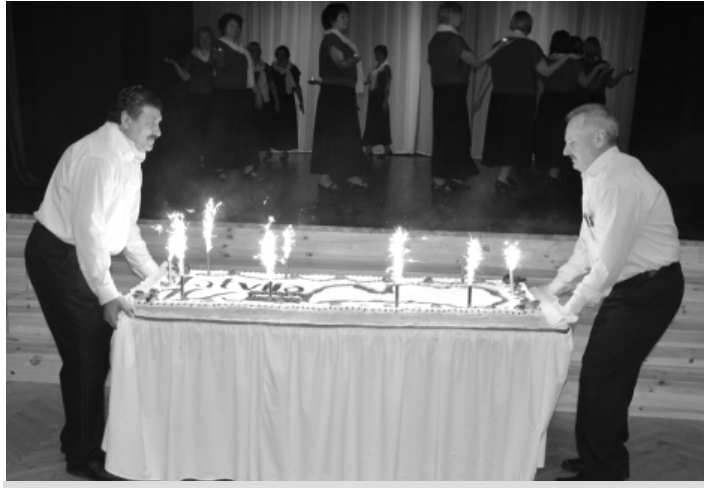
Ar lielo Simtgades torti tika cienāti visi pasākuma apmeklētāji