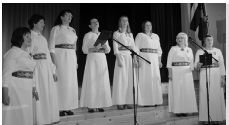
Sieviešu vokālais ansamblis