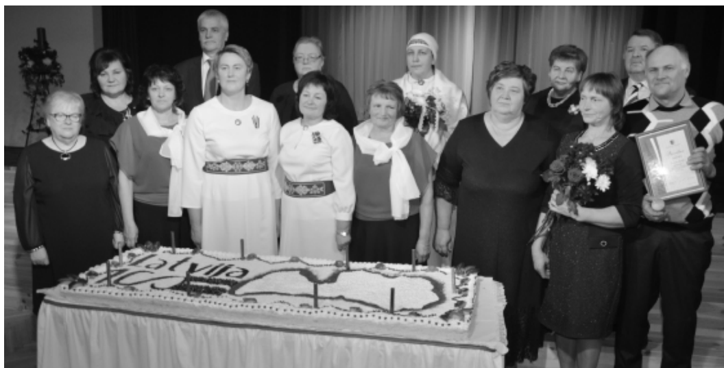
Balvas “Baltinavas novada Lepnums 2018” laureātu kopbilde