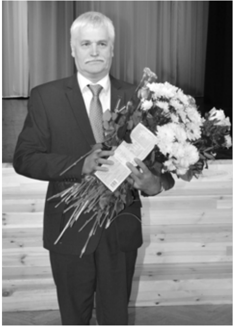
Imantam Slišanam - apbalvojums par mērķtiecīgu darbību valsts mērogā lauku skolu saglabāšanas jautājumā