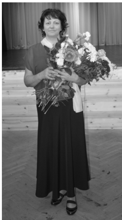
Lilitai Kūkojai - apbalvojums par aktīvu dalību Baltinavas novada izglītības, kultūras un sporta jomas attīstības veicināšanā Baltinavas novadā un ārpus tā