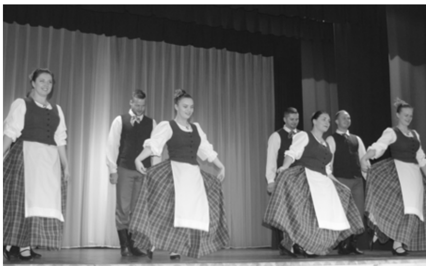
Simtgades pasākuma apmeklētājus priecēja brašie Jauniešu deju kopas “Kust i kust” pārstāvji