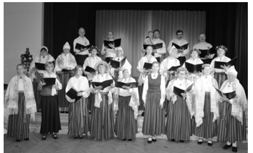
Baltinavas novada jauktais koris arī saņēma LNKC Atzinības rakstu par piedalīšanos Vispārējos Dziesmu svētkos