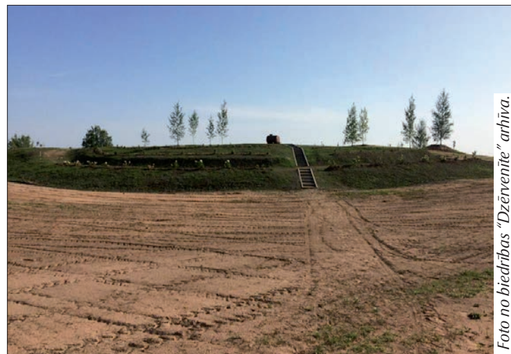
Tagad Bērzpilī ir par vienu sakoptu vietu vairāk.

Atbalsta Zemkopības ministrija un Lauku atbalsta dienests