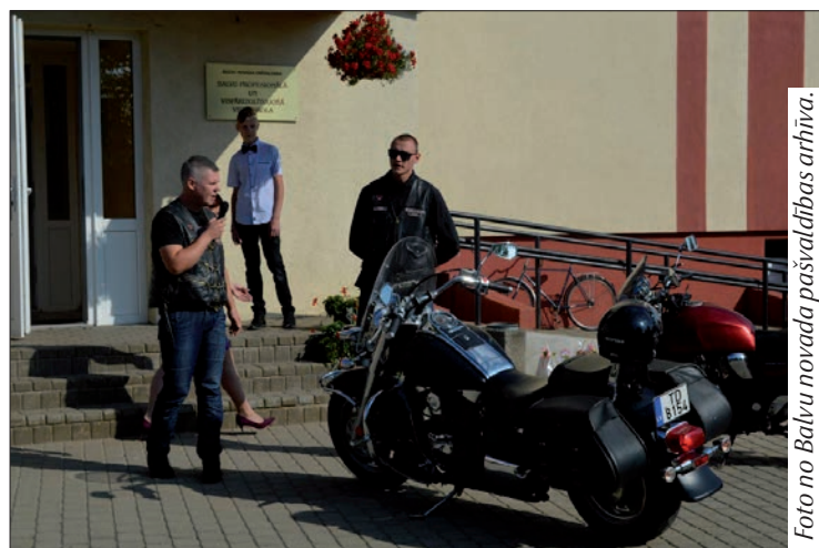
Balvu Profesionālās un vispārīgglītojošās vidusskolas un Rīgas Valsts tehnikuma struktūrvienības skolēnus ieradās sveikt motokluba "Spieķi vēja" pārstāvji, kuri vēlēja ne tikai labi mācīties, bet arī klausīt skolotājus.