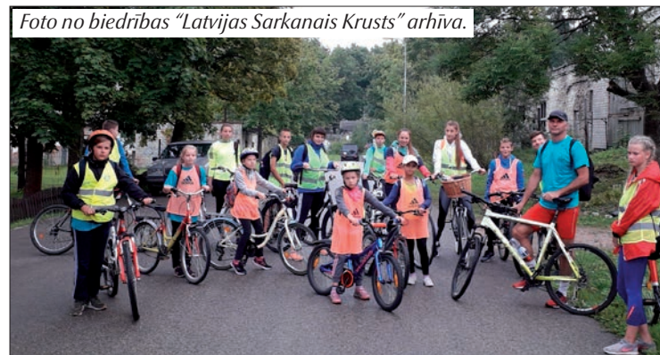
Nometnes dalībnieki devās velobraucienā uz Viksnas pagasta Sprogu ezeru.

Šī dienas nometne tiek organizēta Balvu novada pašvaldības projekta "Pasākumi vietējās sabiedrības veselības veicināšanai Balvu novadā" Nr.9.2.4.2./16/1/050 ietvaros, un to realizē biedrība "Latvijas Sarkanais Krusts" Balvu komiteja.