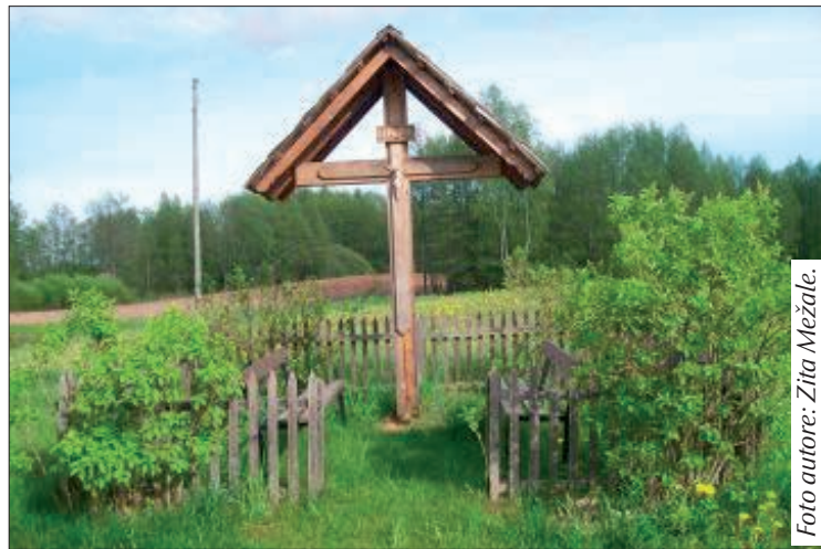
Krucifikss Balvu novada Briēžuciema pagasta Bēliņos.