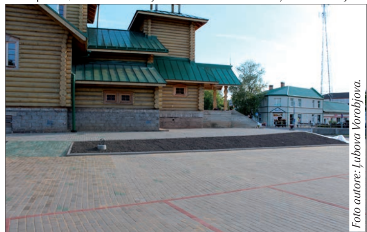
Labiekārtotais pagalmis blakus baznīcai.