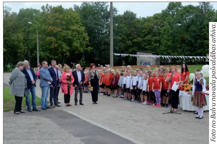
Bērni ar nepacietību gaida sportiskās aktivitātes jaunajā stadionā.

Sportisku garu un teicamas sekmes visu mācību gadu!