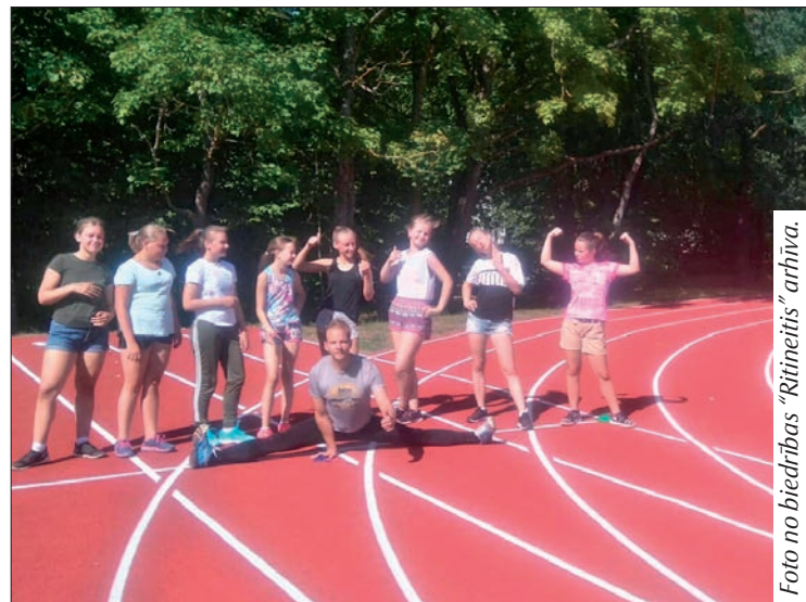
Katru dienu nometnē divas stundas tika veltītas sporta nodarbībām.

Šī dienas nometne tiek organizēta Balvu novada pašvaldības projekta "Pasākumi vietējās sabiedrības veselības veicināšanai Balvu novadā" Nr.9.2.4.2./16/1/050 ietvaros, un to realizē biedrība "Ritineitis"