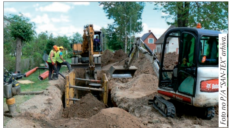
Tīklu izbūve Bēru ielā.