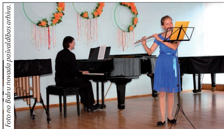
Balvu Mūzikas skolas skolēni jau pirmajā skolas dienā bija gatavi sniegt muzikālus priekšnesumus.

"Tieši tāpat viss notiek un notiks Balvu Valsts ģimnāzijā, jo arī jaunā mācību gada tēma ir "Celsim skolu!". Noteikti jau esat pamanījuši, ka top jauns stadions, tieši tāds, kādu jūs jau sen esat pelnījuši. Arī mācību telpas iegūs pavisam citu izskatu, tās būs modernākas, tajās varēs ērti un radoši strādāt. Balvu novada pašvaldības vārdā novēlu darbu, ražīgu un ļoti veiksmīgu jauno mācību gadu!", teica A.Petrova.