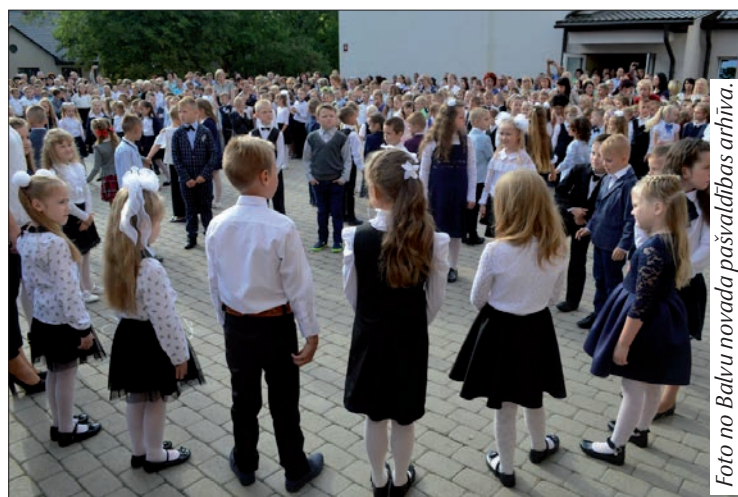
Balvu pamatskolas pagalmā pirmklasniekiem bija tas gods stāvēt pašā viducī.