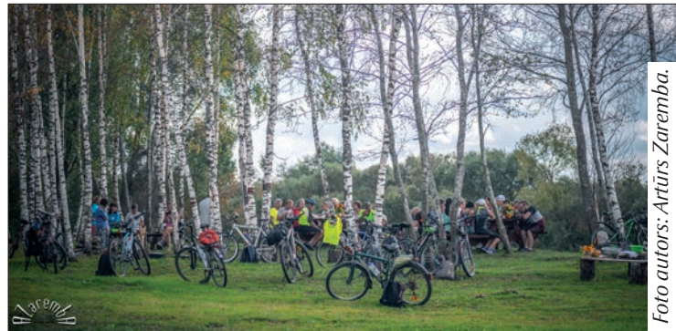
Maltītes ieturēšana Ičas upes krastos.