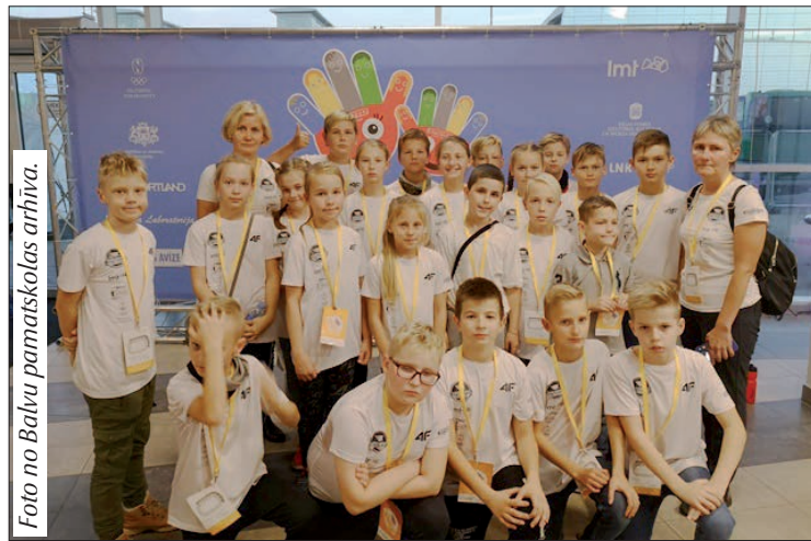
Balvu pamatskolas skolēni kopā ar skolotājām.