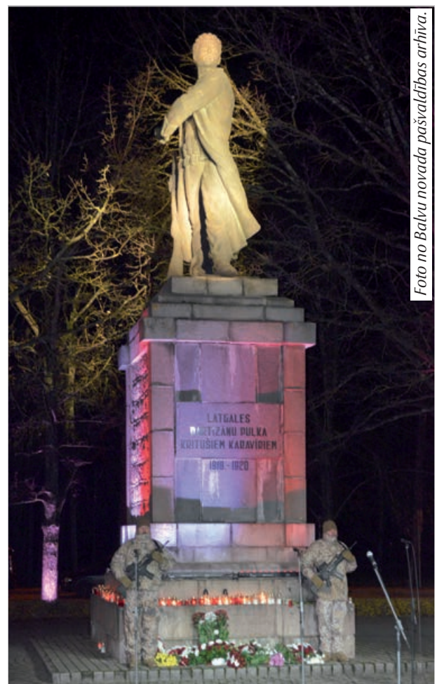
Kopš pieminekļa atklāšanas pagājuši jau 80 gadi.