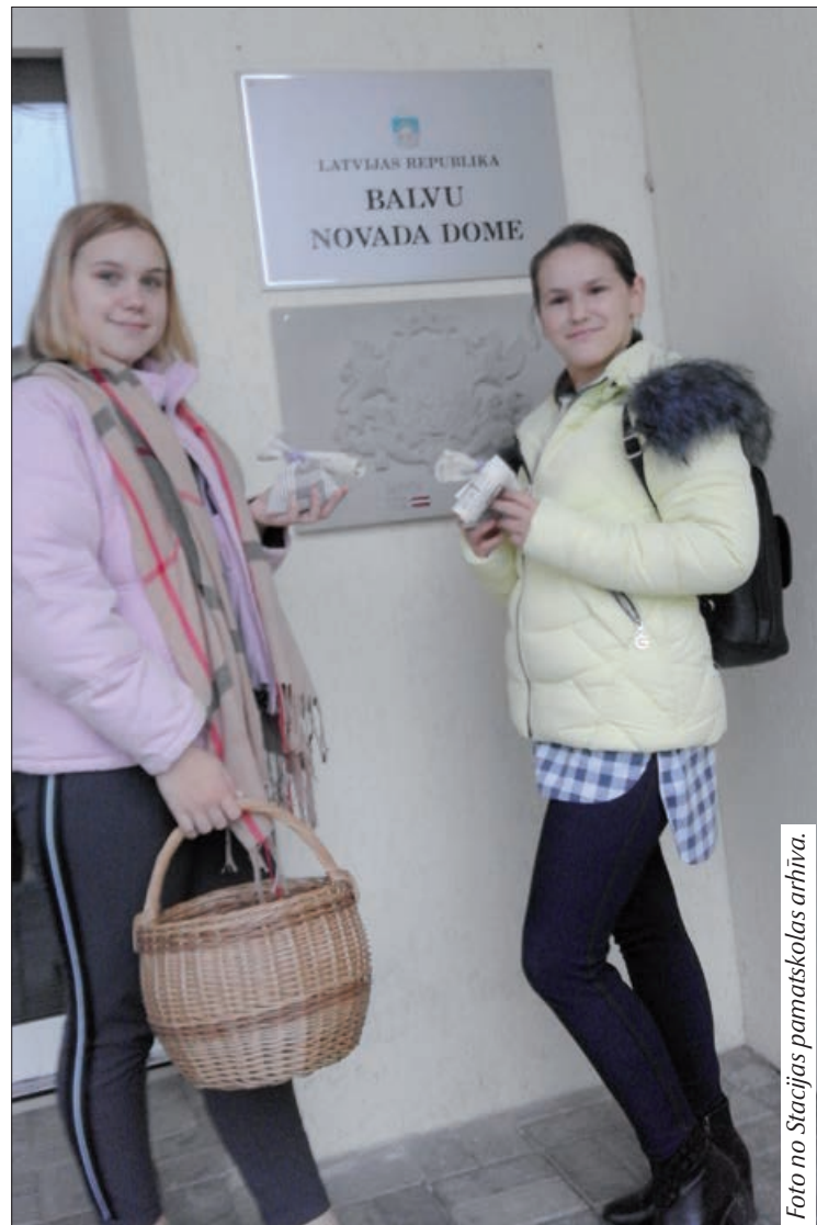
Foto no Stacijas pamatskolas arhīva. Stacijas pamatskolas pārstāvji viesojās arī Balvu novada dome.