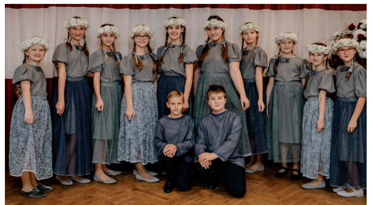
Balvu Mūzikas skolas kora klases ansamblis.