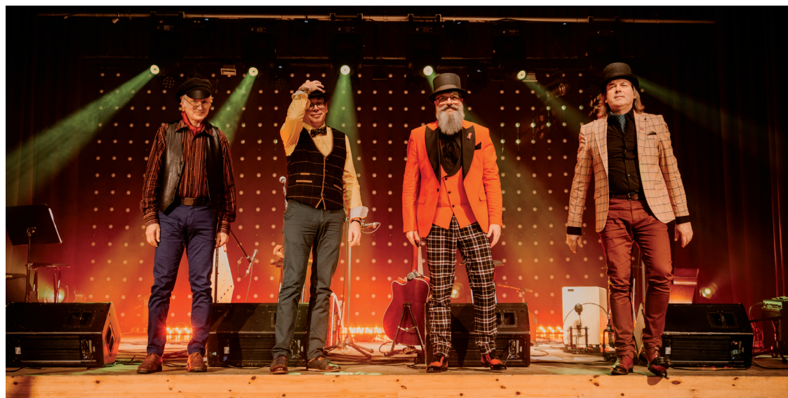
Pasākuma pirmajā daļā muzicēja ekoloģiskās mūzikas grupa "Ducele".