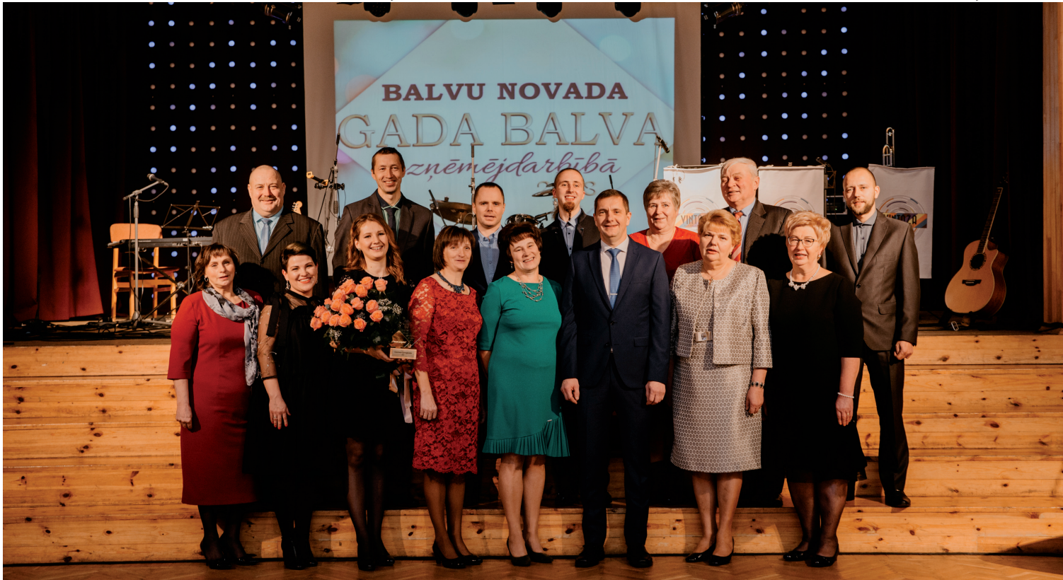
"Balvu novada Gada balva uzņēmējdarbībā 2018" nomināciju saņēmēji.

Gadam tuvojoties uz beigām, kā ierasts, tika sumināti novada uzņēmēji pasākumā "Gada balva uzņēmējdarbībā 2018". Šogad novitāte bija tā, ka konkurss tika rīkots divās kārtās, balstoties uz iepriekš izstrādātu un novada Domes sēdē apstiprinātu nolikumu. Pirmajā kārtā nominantus konkursam pieteica iedzīvotāji, organizācijas, uzņēmuma kolektīvi, komersanti, biedrības, aizpildot pieteikuma anketu. Otrajā kārtā pieteikumus izskatīja konkursa komisija, kas varēja izvirzīt arī savus pretendentes.