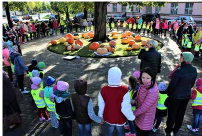
Ja pirmajos ķirbju svētkos pagājušajā gadā piedalījās novada 1. – 9.klašu skolēni ar 14 ķirbjiem, tad šogad konkursā piedalījās gan skolēni, gan pieaugušie