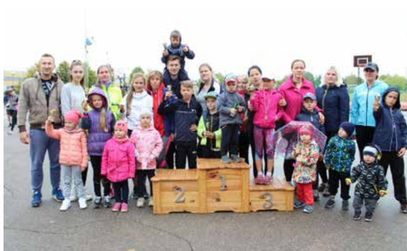
Ģimeņu skrējienā piedalījās 11 azartiskas un atraktīvas ģimenes

Skrējiens pa Ilūkstes ielām ir kļuvis par neatņemamu ikgadēju rudens sporta notikumu mūsu novadā. Tā galvenais mērķis ir popularizēt vieglatlētikas skrējienus un veselīgu dzīvesveidu visu vecumu Ilūkstes novada iedzīvotāju vidū, veicināt viņu vēlmi būt fiziski aktīviem savās ģimenēs, kā arī stiprināt draudzīgas attiecības ar citu novadu, reģionu un kaimiņvalstu sportistiem.