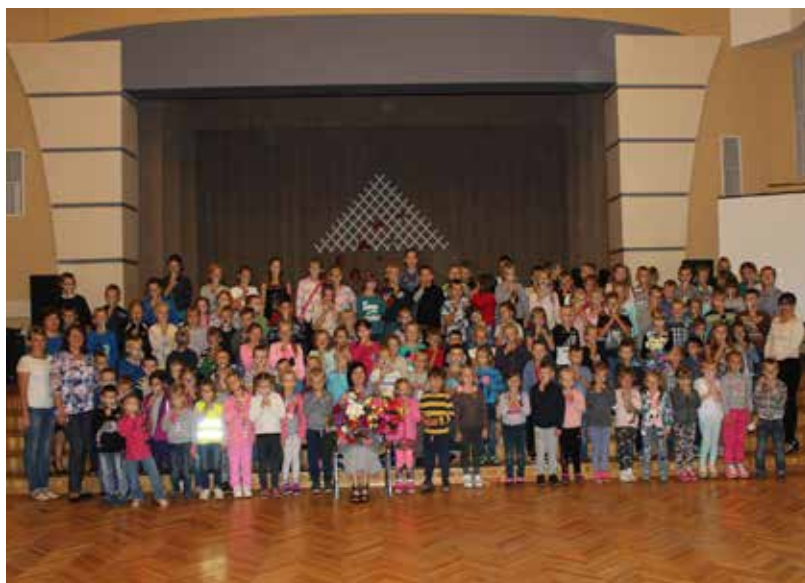
Dzejnieci satikt bija ieradies kupls pulks bērnu

Ilūkstes pilsētas bērnu bibliotēkas vadītāja