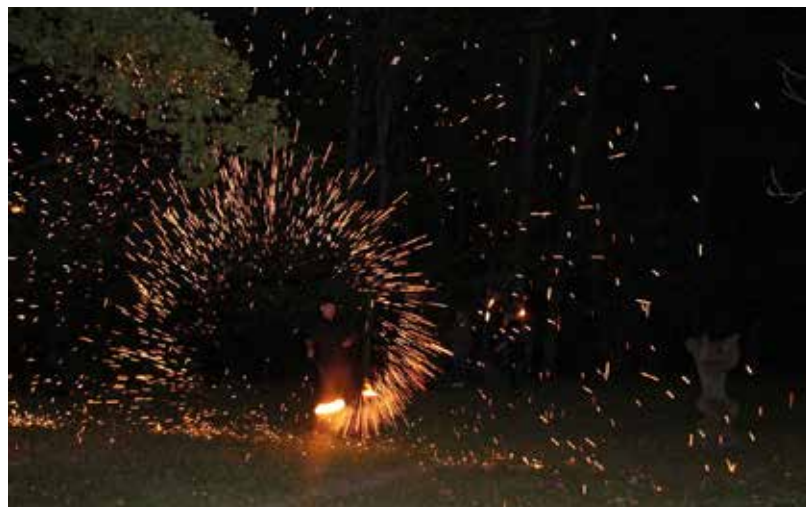
Pārgājiena izskaņā apmeklētājus priecēja uguns teātris no Daugavpils