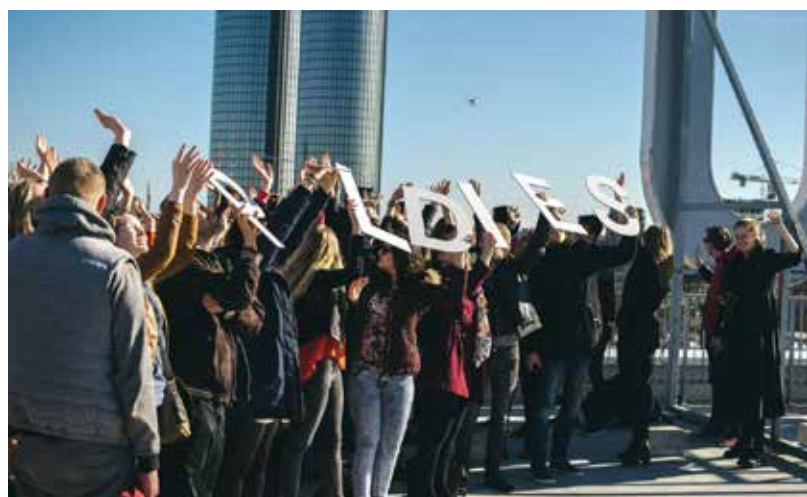
No Ilūkstes novada šajā mācību gadā ar fonda administrētajām stipendijām studēs 9 jaunieši

Pateicoties 203 ziedotājiem no Amerikas, Austrālijas, Kanādas, Lielbritānijas, Venecuēlas, Zviedrijas, Vācijas, Dānijas, Ēģiptes, Izraēlas un Latvijas, jaunajā mācību gadā Vītolu fonds administrēs un izmaksās 704 stipendijas. Ar ziedotāju atbalstu studijas uzsāks 282 pirmkursnieki, bet 422 esošie stipendiāti studijas turpinās. Šajā mācību gadā fonds izmaksās vairāk kā 1 200 000 EUR.