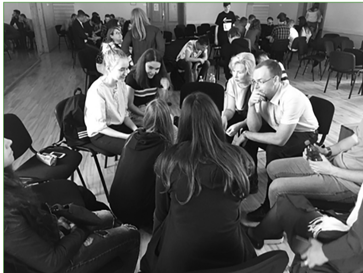
Līgatnes pārstāvji projekta noslēguma konferencē

jaunatnes darbinieki atzina, ka projekta ietvaros organizēto semināru laikā darbs kopā ar jauniešiem bijis lietderīgs, izziņot tieši viņu vajadzības, jo ne vienmēr pieaugušo redzējums sakrīt ar pašu jauniešu viedokli, kas ir būtisks priekšnosacījums kvalitatīvai jaunatnes politikas stratēģijas izstrādei - lai tā tiktu veidota, respektējot dažādus skatu punktus.