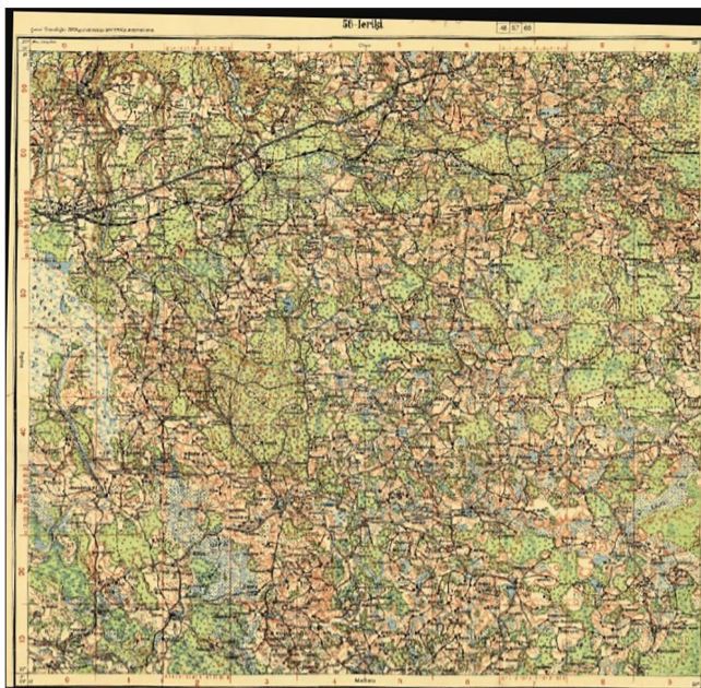
1928. gada karte pēc 1907. gada uzņēmuma. Kopumā.