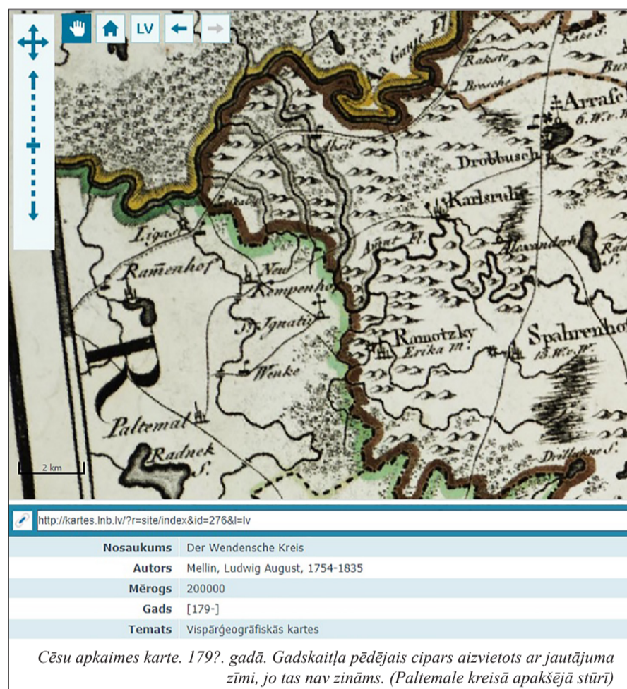
Cēsu apkaimes karte. 1798. gadā. Gadskaitļa pēdējais cipars aizvietots ar jautājuma zīmi, jo tas nav zināms. (Paltmale kreisā apakšējā stūrī)