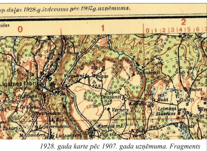
1928. gada karte pēc 1907. gada uzņēmuma. Fragments