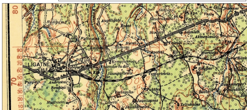
1928. gada karte pēc 1907. gada uzņēmuma. Fragments palielinājumā. (Uzraksts "LĪGATNES FABRIKA" kartes kreisajā malā vidusdaļā.)

Paltmale, Siguldas draudzē. Neļūstamais iebūvums, kuru lūgš šim ļauža „Paltmalešs” udbens bīstnawas, ar Vidzemes guberņas walbes atkauju turpmat ļaužams par „Wifšendorfu”. Paltja adreše gar L i g a t e s štauju (чр. ст. Лигатъ), bet apdrošinatām weštulem un naudas ūhtijumeem gar S i g u l d u (чр. ст. Зегевольц).