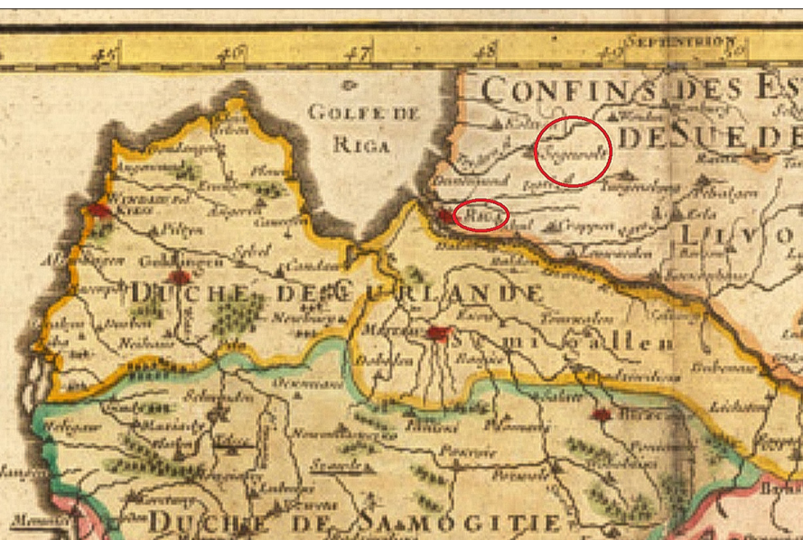
Autors: Alexis Hubert Jaillot. Karte datēta ar 1708. gadu.