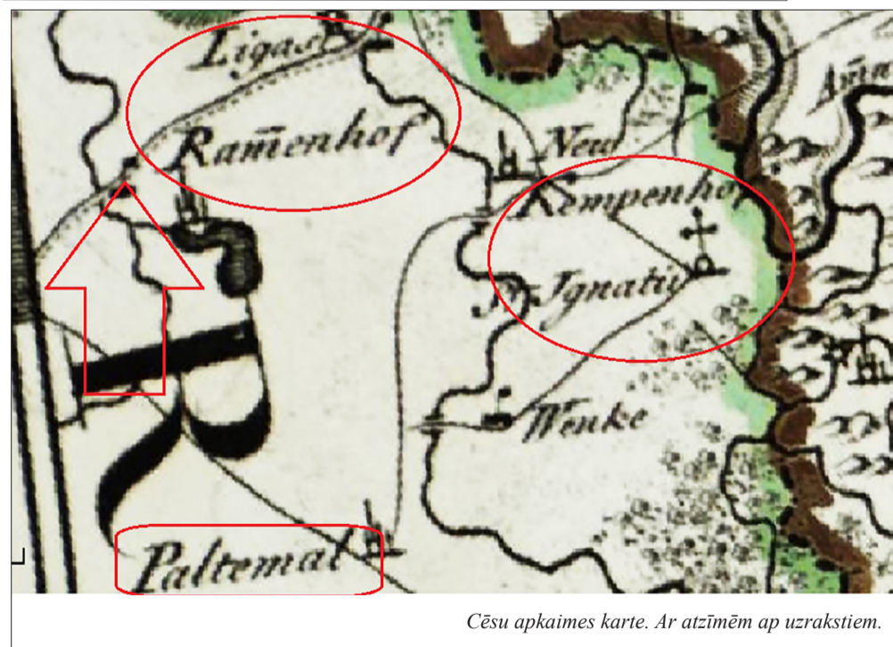
Cēsu apkaimes karte. Ar atzīmēm ap uzrakstiem.

fabrikas pārvalde liek novest uz zināmiem eksaminācijas punktiem dēļ liecību iegūšanas par sekmīgu skolas beigšanu.