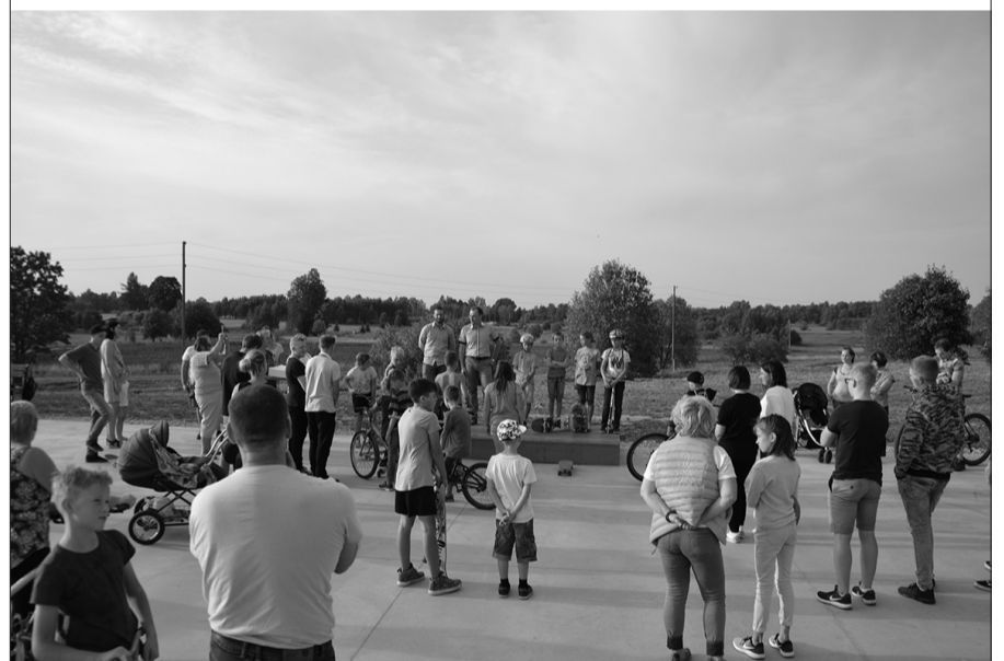
Skeitparka atklāšana Augšlīgatnē.