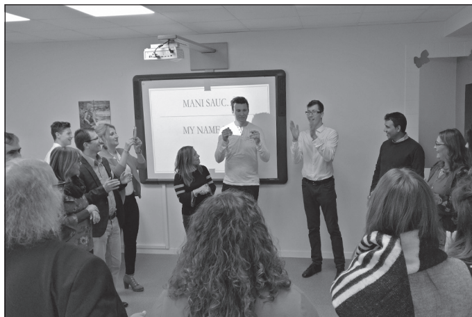
10. klases skolēni vada latviešu valodas stundu viesiem