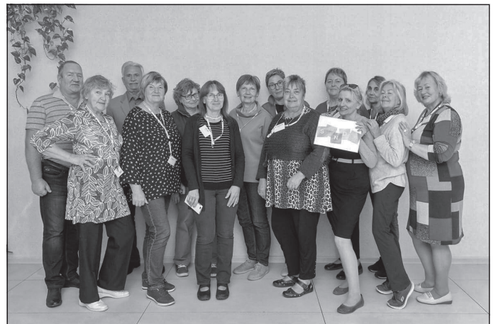
Mācību fotosesijas noslēgumā