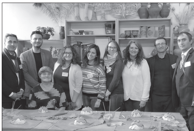
Pirmie keramikas darbi