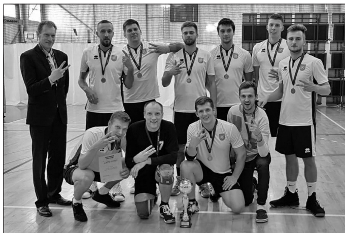
Mālpils komanda – 3. vietas ieguvēji Pierīgas novadu sporta spēlēs volejbolā

Sporta darba organizators Ģirts Lielmežs