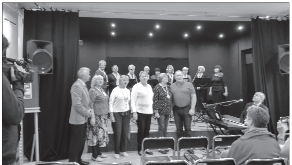
Latviešu tautdziesmas skan Polijā