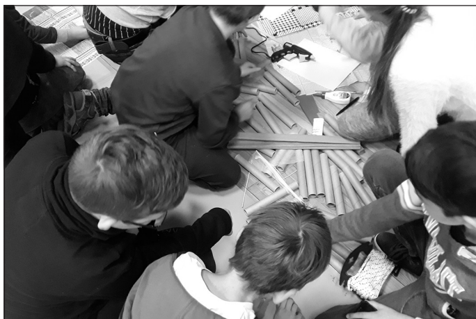
Darbs radošajās darbnīcās