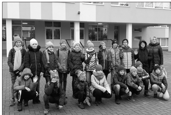
Klaipēdas delegācija pie Mālpils vidusskolas