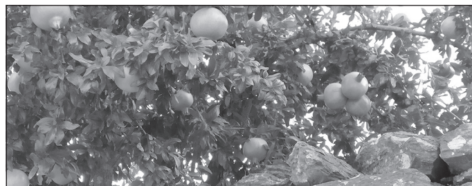
Tā aug granātāboli