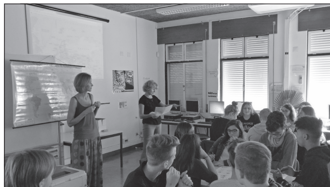
Mūsu skolotājas vada stundu starptautiskajai skolēnu grupai

Projektu līdzfinansē Eiropas Savienība Vairāk par ERASMUS+ programmu var uzzināt www.viaa.gov.lv