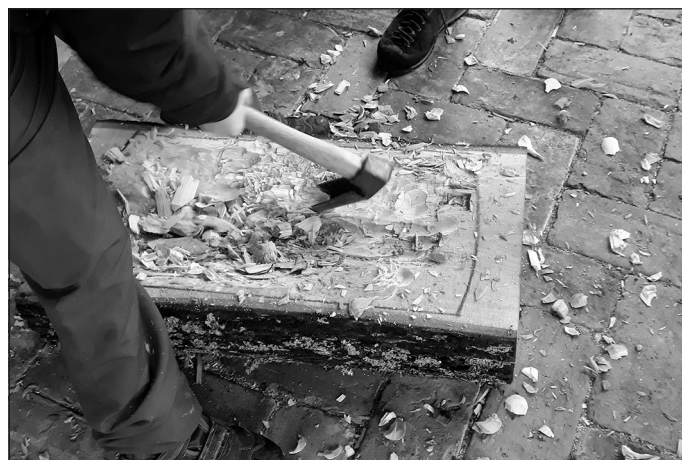
Koka sagatave kuģa izveidei