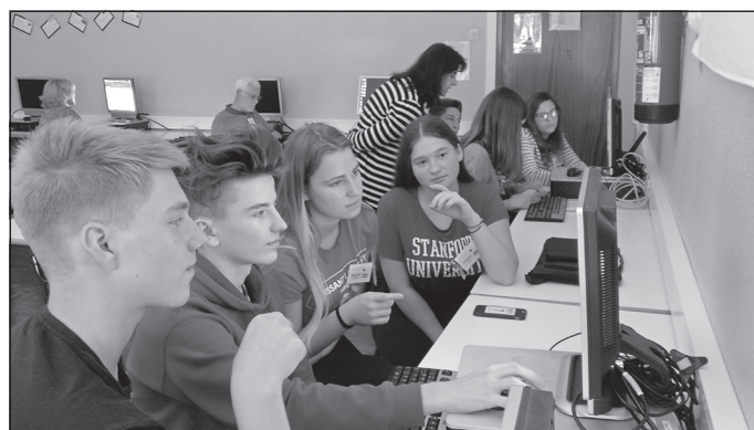
Video veidošanas stunda