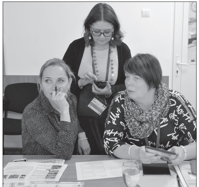
Veicot mācību uzdevumus

Vairāk par ERASMUS+ programmu var uzzināt www.viaa.gov.lv