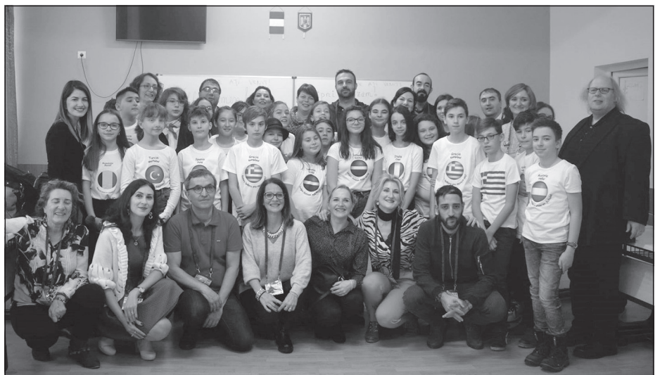
Kopā ar kolēģiem un rumāņu skolēniem