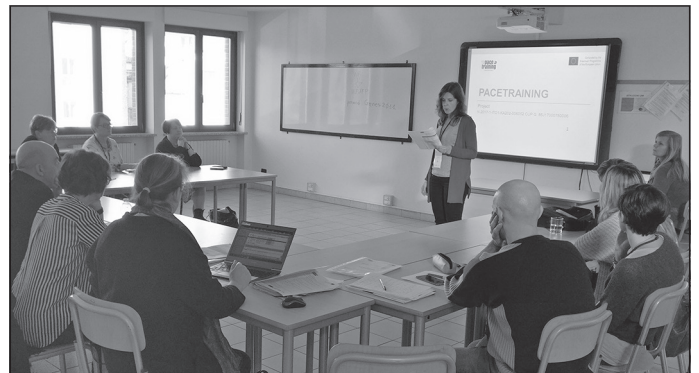
Dace un Gunta vada nodarbību kolēģiem

Vairāk par ERASMUS+ programmu var uzzināt www.viaa.gov.lv