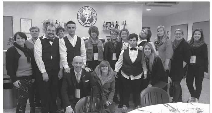
Kopā ar mācību grupu