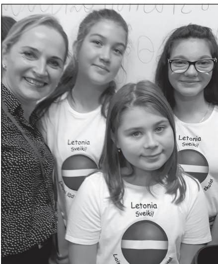
Ar rumāņu meitenēm