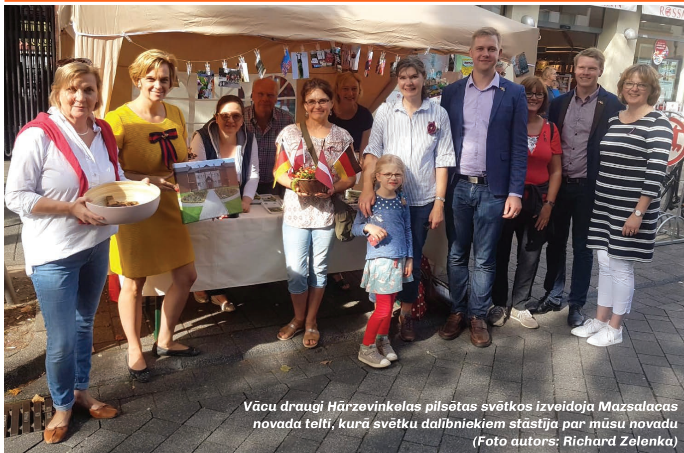
Vācu draugi Hārzevinkelas pilsētas svētkos izveidoja Mazsalacas novada telti, kurā svētku dalībniekiem stāstīja par mūsu novadu