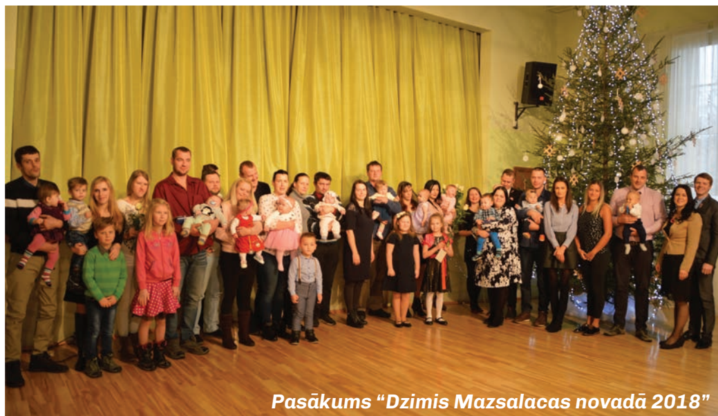
Pasākums "Dzimis Mazsalacas novadā 2018"