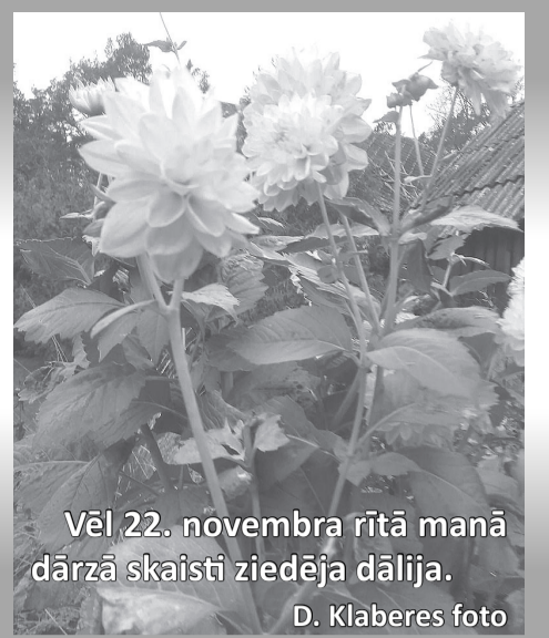
Vēl 22. novembra rītā manā dārzā skaisti ziedēja dālija.