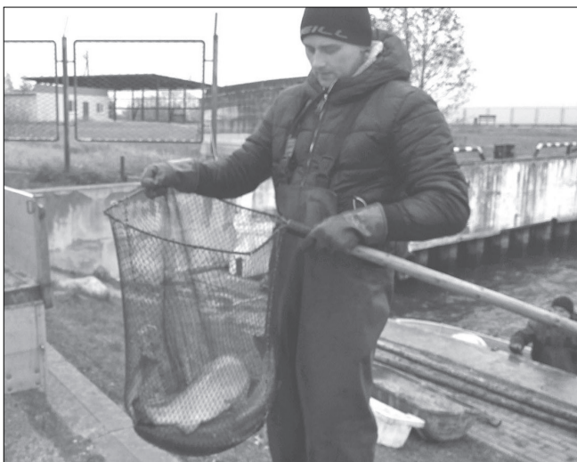
Par taimiņu vaisliniekiem rūpējās SIA „Pundiķi” vīri.

Projekta kopējās izmaksas ir 3 000,00 EUR, no kuriem Rojas novada domes līdzfinansējums ir 600,00 EUR, un Zivju fonda finansējums ir 2 700,00 EUR.