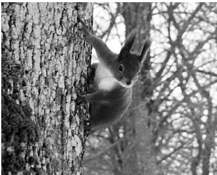
Ziņkārīgā vāvere no Turlavas.