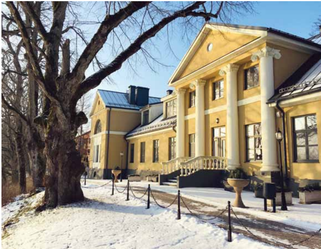
Atjaunotā Skrundas muiža zaļo sertifikātu iegūst pirmo reizi. Te darbojas viesnīca, restorāns, SPA ēka un muzejs.