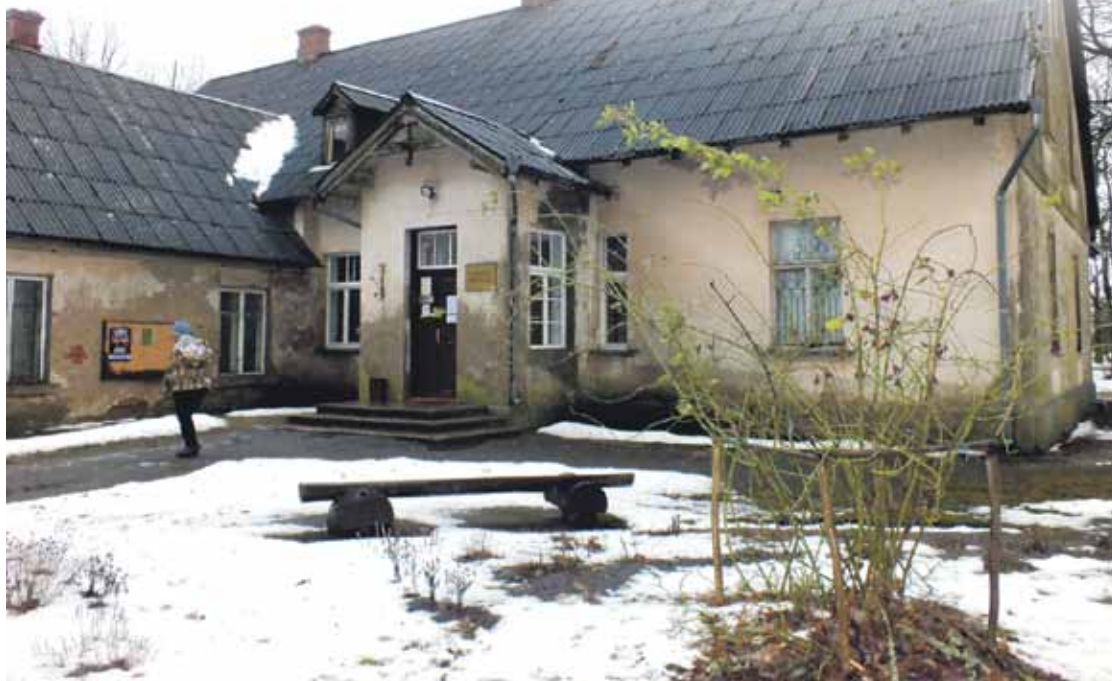
Veclikupēnu muižas otrajā stāvā kopš 1949. gada ir Likupēnu bibliotēka. Apkaimē dzīvo 150 cilvēki, pērn bibliotēku apmeklēja 60 pieaugušie un 15 bērni.

Kopumā valstī nav raksturīgi slēgt ekonomiski neizdevīgas un maz apmeklētas bibliotēkas. Pērn vienu aizslēdza Jelgavas novadā – tā atradās privātā īpašumā, kas bija kritiskā stāvoklī. "Sešām vai septiņām mainīja statusu. Cita situācija ir ar skolu bibliotēkām, tās likvidē reize ar skolu. Interesanti, ka Jēkabpils novada Tadenavas bibliotēka ir tikai 10 lietotāji, tomēr pašvaldībai nenāk ne prātā to slēgt. Lielākas pūles jāpieliek, lai mainītu attieksmi pret bibliotēku darba laiku. Tas jāpielāgo iedzīvotāju vajadzībām, tātad jāiekļauj arī sestdiena, svētdiena. Latvijā ir daudz piemēru, kad bibliotēkas pakalpojumi kļūst pieejami gan drīz katram, ja bibliotekārs izprot savas apkaimes iedzīvotāju dienas gaitas un paradumus. ■