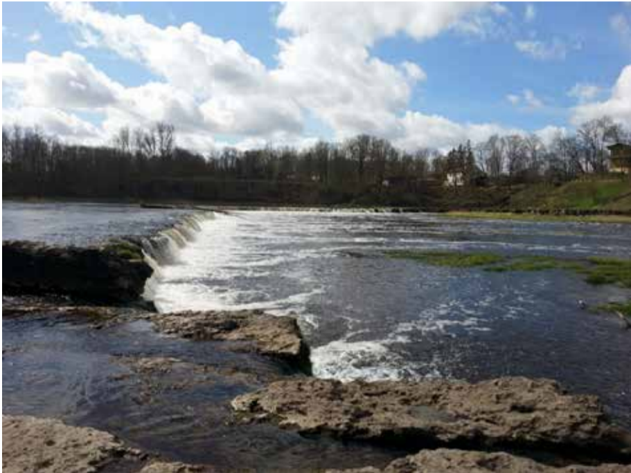
1. vietas ieguvēja Anna par savu foto saņēma 136 balsis.