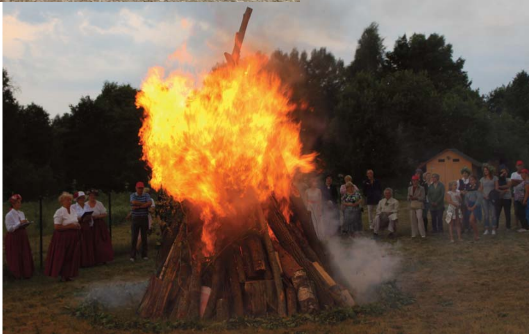
Plkst. 22.00 Pilskalnē pie ugunskura pasākuma dalībnieki vienojās kopīgā Latvijas himnas dziedāšanā

Pēc noietā kilometra gan tie, kas nogāja kādu no "1836" posmiem, gan citi interesenti pulcējās Pilskalnes pagasta estrādē, lai pie ugunskura, kur ikviens ar savu mal-