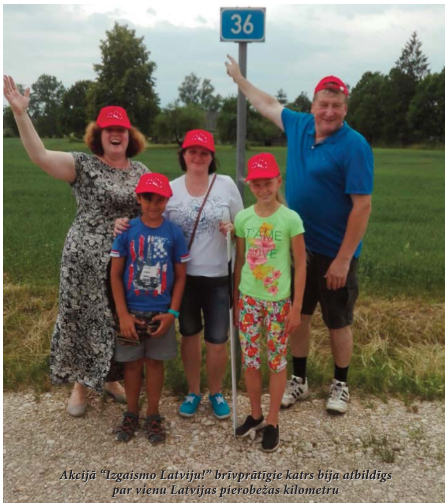
Akcijā "Izgaismo Latviju!" brīvprātīgie katrs bija atbildīgs par vienu Latvijas pierobežas kilometru

kas pagalti jau pēc iedibinātas tradīcijas aizkūra Saulgriežu ugunskuru, un pēcāk vienojās spēka dziesmās Latvijai. Muzikālo garu palīdzēja uzturēt arī Aizkraukles novada folkloras kapela "Karikste", iesaistot iedzīvotājus jautros dančos un dziesmās.