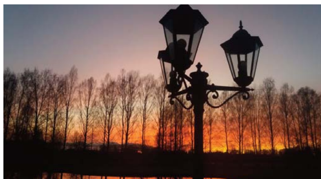
Neretas Jāņa Jaunsudrabiņa vidusskolas uzvarētājas Saivas Staģītes darbs

grupa turpinās līdzekļu piesaisti, palielinot izgatavojamo foto gleznu skaitu katrai skolai.