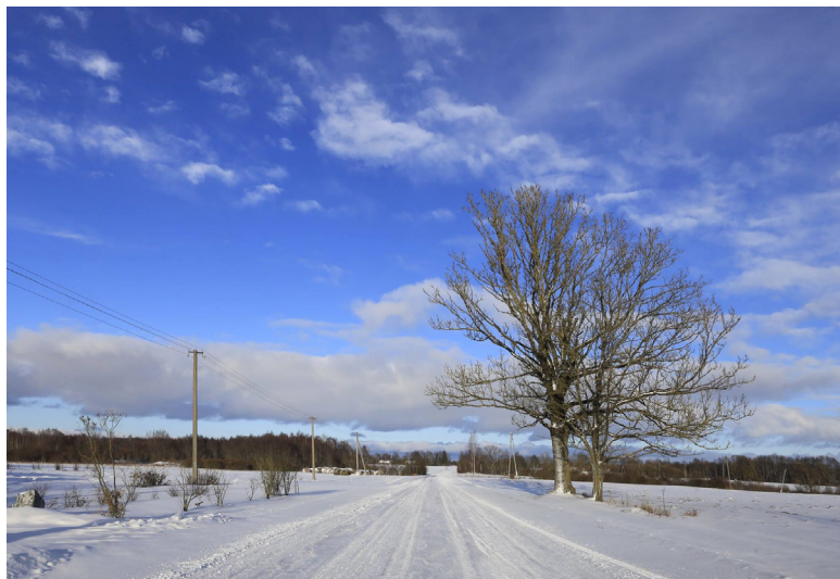
Ziemas skats Vārkavas novada «Vepros»