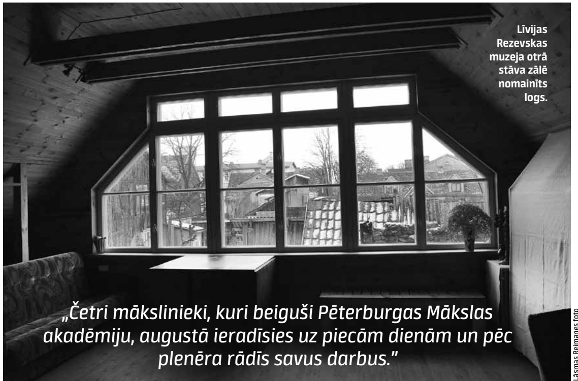
Līvijas Rezevskas muzeja otrā stāva zālē nomainīts logs.