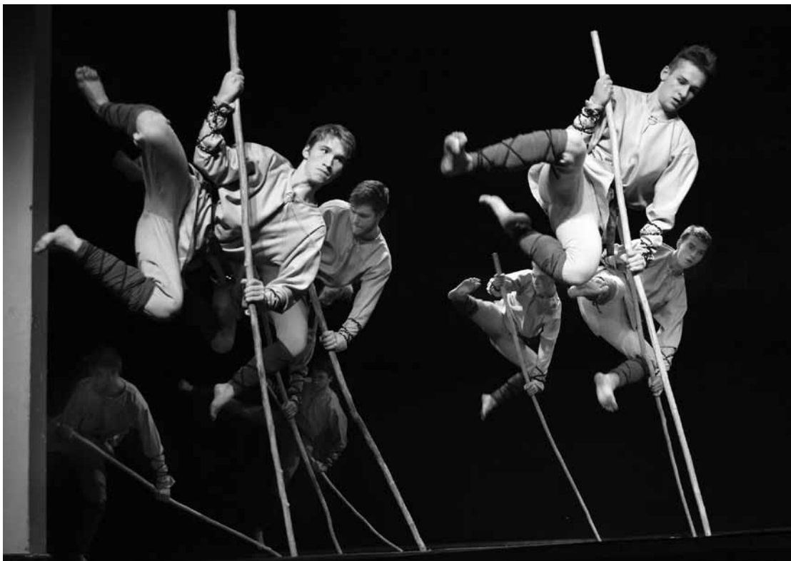
Tautas deju ansambļa Venta pašreizējais pamatsastāvs esot fantastisks – citi skaudībā prasot, kur Kuldīgā izrauti tik vareni puiši.

Vadītāja sapņo, ka aizplūšana beigsies un Ventā viņa atkal varēs strādāt ar paaudzi no 16 līdz 26 gadiem. „Varbūt līdz pensijai sapnis īstenosies,” smeļ optimistiskā pedagoģe. Lai arī pašreiz pamatsastāvs ir padsmītgadīgie, vadītāja par desmit puišiem un 13 meitenēm ir sajūsmināta: „Esmu tieša, prasīga, ar humora izjūtu, bet paasa vārdos. Ar tagadējiem jau esam izēduši nevis septiņus pudus sāls, bet kādus 107. Tāda fantastiska attieksme pret darbu. Neapraktāmi, ko viņi var izdarīt! Ņem pretī visu, un es arī mēģinu dot. Citi skolotāji prasa, kur es Kuldīgā tādus džekus esmu izrāvusi. Bērni nepiedzimst vienlīdz talantīgi visās jomās. Uz kultūras namu atnāk tie, kuri neiet sportot vai neaizraujas ar eksaktajām zinībām. Atnāk tāds vai citāds, es ar viņu strādāju tāpat kā ar pārējiem – veidoju labus dejojājus. Ir bijušas spēcīgas grupas, kas kļuvušas par laureātēm konkursos. Un tad atkal ir kāds tukšais brīdis. Galvenais ir dabūt uz viena viļņa. Ja tas izdodas, tad pēc smagajiem