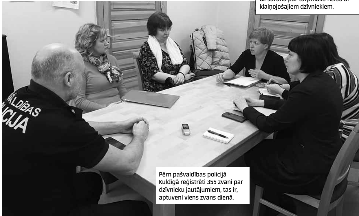
Pērn pašvaldības policijā Kuldīgā reģistrēti 355 zvani par dzīvnieku jautājumiem, tas ir, aptuveni viens zvans dienā.

Pirmdien, 11. februārī, 16.00 Kuldīgas novada domē pašvaldības speciālisti, veterinārārsti, policijas pārstāvji, nevalstisko organizāciju aktivisti un citi interesenti aicināti uz sarunu par turpmāko rīcību ar klaiņojošajiem dzīvniekiem.