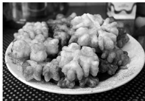
Šādas eļļā vārītās rozītes daudziem alsundzniekiem atmiņā palikušas kā lielākais bērnības gardums.

Nākamreiz, 23. februārī, komunālā dzīvokļa stāstos runāšot par modi.