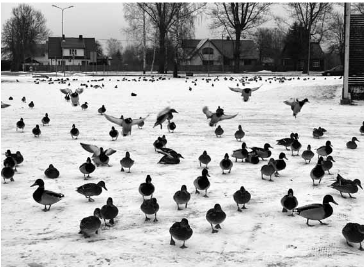
Pīļu armija Piltenes ielā Kuldīgā.