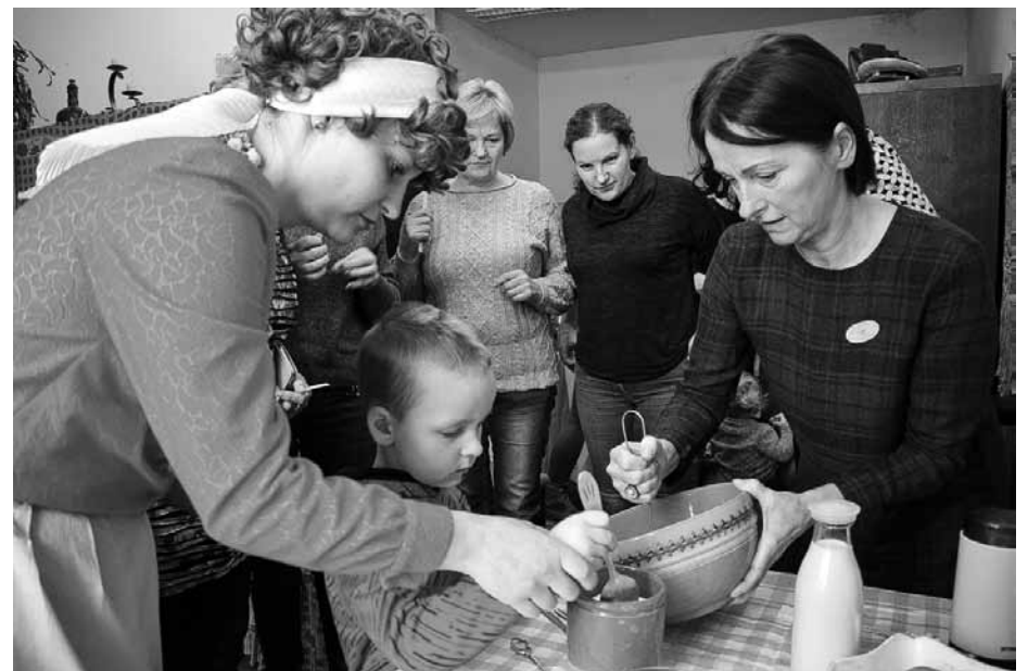
Pasākumā Komunālā dzīvokļa stāsts – bērnības garša kopīgiem spēkiem top našķi.

Jolanta Hercenberga Ilonas Balodes arhīva foto