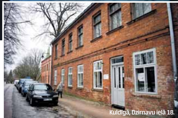
Kuldīgā, Dzirmavu ielā 18.

Maznodrošinātajiem un trūcīgajiem – bez maksas. Ar sociālā dienesta nosūtījumu 1,20–1,45 eiro (tāl. 27020746, 27020734). Bez dienesta starpniecības 12–14,50 eiro, jāzvana samariešiem pa tālr. 25691384.