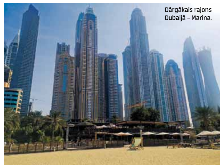
Dārgākais rajons Dubajā – Marina.

Bet musulmaņu ticībā pieļaujama daudzsiēvība. Ceļojumā iepazinās ar arābu sievieti, un viņa nedaudz par sevi pastāstīja. Esot viena no četrām sievietēm, un tā dzīvot neesot viegli. Greizsirdību nevarot kontrolēt, un viņas jūtoties tāpat kā mēs, eiropietes. Viņa teica tādu vārdu: „Asaras dzimst sirdī, nevis galvā.” Par to pie mums nerunā.”