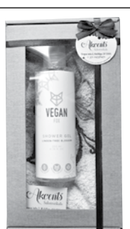
Februāra uzvarētājam dāvana gādāta sadarbībā ar salonveikalu Akcents .

Atminējumu, izgrieztu no laikraksta (ne kopētu), sūtiet uz redakciju Krustvārdu mīklu konkursam, Kurzemnieks , 1905. gada ielā 19, Kuldīgā, LV-3301, vai iemetiet redakcijas vēstulju kastītē.