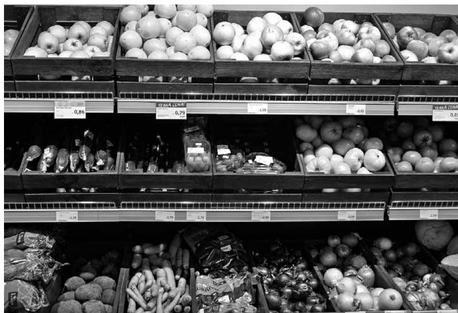
Kopš pērnā gada PVN no 21% samazināts līdz 5%, lai celtu Latvijas dārzeņu un augļu ražotāju konkurētspēju un palielinātu iedzīvotāju pirktspēju, kā arī mazinātu nelegālo tirdzniecību.

Valsts ieņēmumu dienesta informācija par pērnā gada 11 mēnešiem liecina, ka apgrozījums pieaudzis par 4,12%. Savukārt vidējais atalgojums tiem nodokļu maksātājiem, kuri pamatdarbība ir lauksaimniecība un kuri norādījuši ar 5% PVN apliekamos darījumus, palielinājies par nepilniem 10%. ZM speciālisti gan skaidro, ka tas saistāms ar vidējās algas palielināšanos valstī.