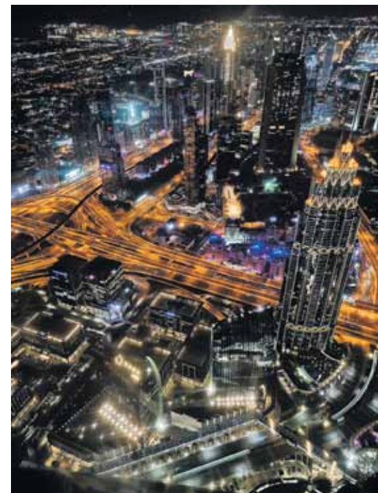
Skats uz Dubaju no pasaulē augstākās celtnes Burj Khalifa .

Pilsēta Apvienotajos Arābu Emirātos (AAE). Dubajas emirāta administratīvais centrs 160 km no galvaspilsētas Abū Dabī. Emirāts atrodas ziemeļaustrumos pie Persijas līča. Platība: 4114 km 2 . Iedzīvotāji: 3,14 miljoni. Valūta: AAE dirhēms.