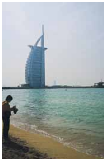
Pasaules smalkākā viesnīca Burj Al Arab .