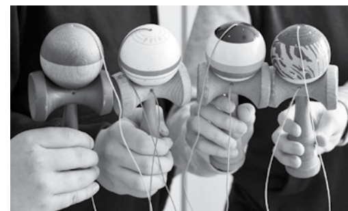
Japānas koka spēles kendamas veidi esot dažādi, bet skolēni iesaka iegādāties oriģinālos, nevis pakalādarinājumus.

Dienā puiši trenējoties vairākas stundas, lai iemācītos ko jaunu. Visi stāsta, ka mājās