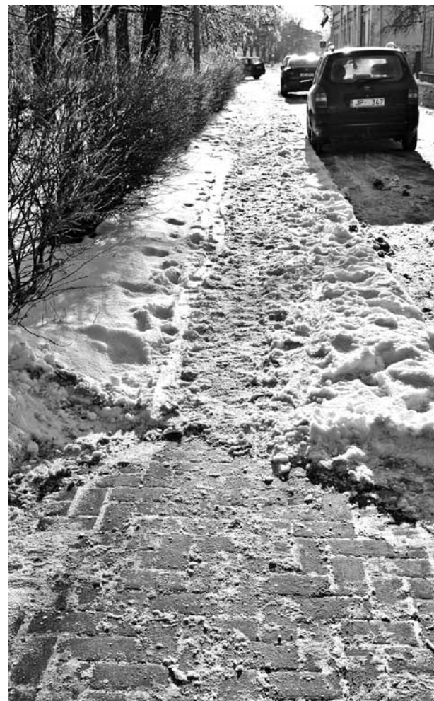
Ietve 1905. gada ielā pie 17. nama.

■ Līgumu ar KKP var noslēgt gan klātienē Pilsētas laukumā 2, 216. kabinetā, gan rakstot e-pastā: kkp@kuldiga.lv, gan mājaslapas www.kkp.lv sadaļā lesniegumi .