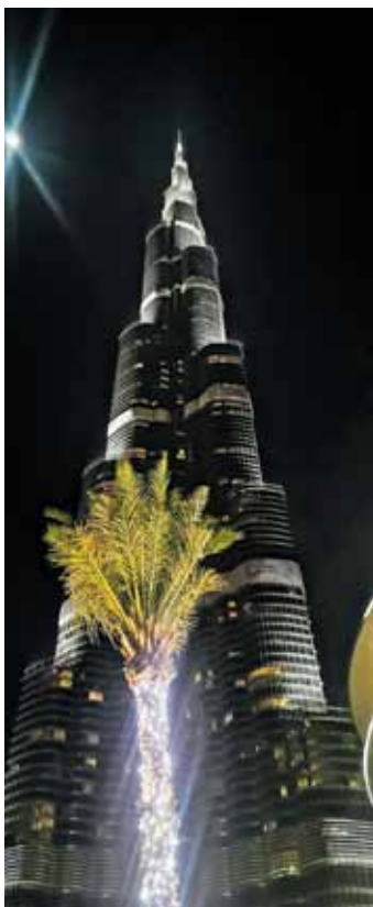
200 stāvu augstā ēka Burj Khalifa .