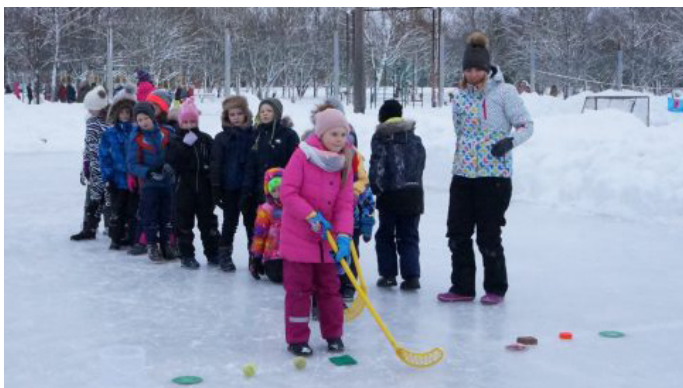
Visi varēja izbaudīt ziemas priekus

25. janvārī, Krimuldas vidusskolas 1.-4. klašu skolēni ar savām audzinātājām pulcējās sporta laukumā uz Sniega dienas aktivitātēm.