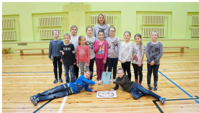
Piedalīties un uzvarēt vienmēr ir patīkami

Sniega dienas norise nebūtu iespējama bez skolēniem – tiesne-