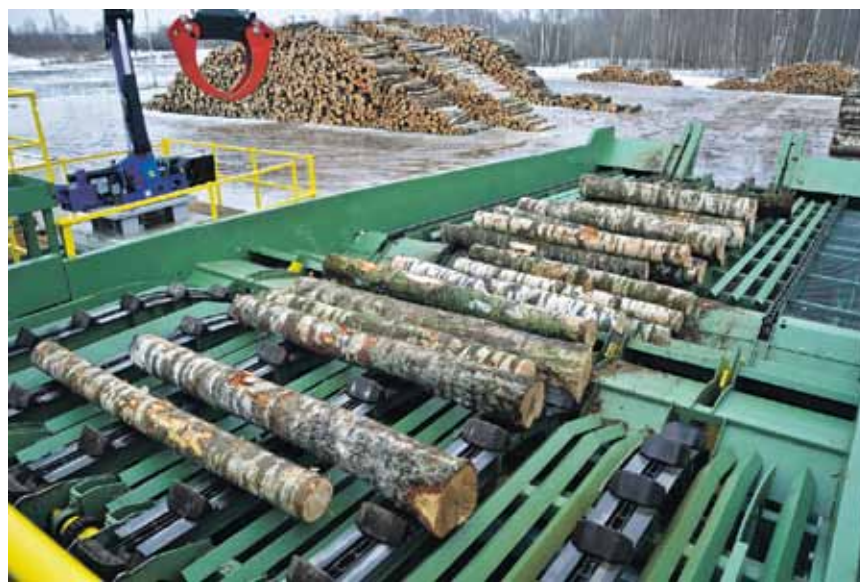
Laukums atvērts tikai pērnruuden, šķirošanas līnija vēl nestrādā ar pilnu jaudu – dienā caur to iziet ap 100 m 3 , bet varētu vismaz 500 m 3 .