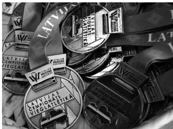
Latvijas čempionātā U18 un U20 grupā izcīnīti 55 medaļu komplekti.