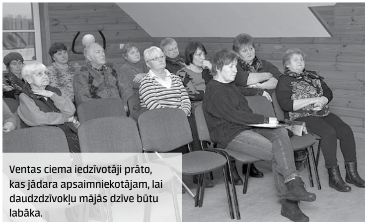
Ventas ciema iedzīvotāji prāto, kas jādara apsaimniekotājam, lai daudzdzīvokļu mājās dzīve būtu labāka.

Savukārt blakus ēkai Rudupes ielā 2 (iekrāti 2758 eiro, parāds 68 eiro) apsaimniekotājs nav darījis neko un arī neplāno, jo tā esot labā stāvoklī. Vienīgi, ja dzīvokļu īpašnieki paši izteiks kādu vēlmi.