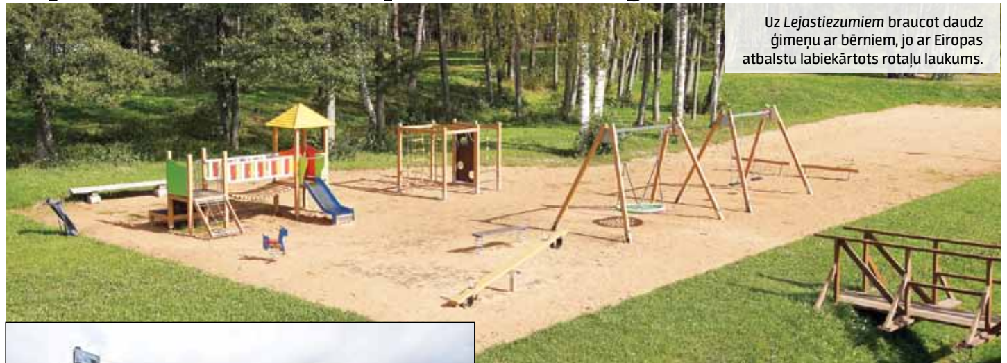
Uz Lejastiezumiem braucot daudz ģimeņu ar bērniem, jo ar Eiropas atbalstu labiekārtots rotaļu laukums.