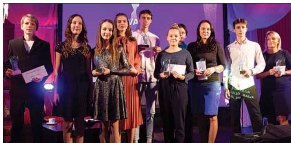
„Jauniešu gada balvas sportā 2018” laureāti.

25. janvārī Ķekavas sporta klubā tika sveikti 2018. gada labākie jaunie sportisti un viņu treneri deviņās nominācijās.