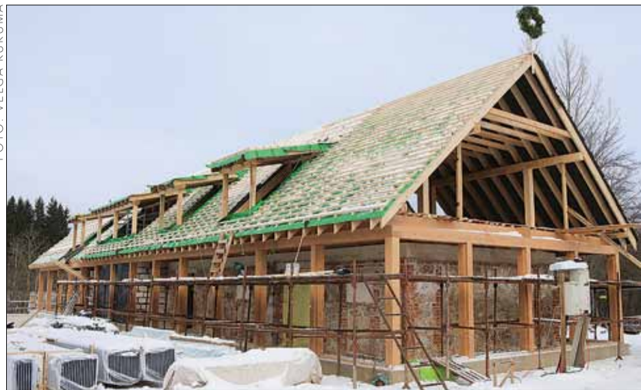
Jauno ideju centra ēkas jumta kori grezno Spāru svētku vainags.