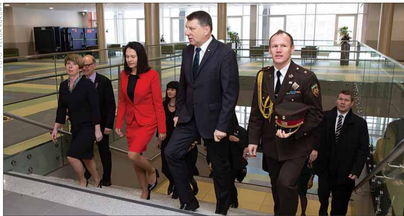
Valsts prezidents Raimonds Vējonis atklāj „Draudzīgā aicinājuma” pasākumu Ķekavas vidusskolas jaunās sākumskolas ēkā.

28. janvārī darba vizītē Ķekavas novadā viesojās Latvijas Valsts prezidents Raimonds Vējonis. Viņš piedalījās „Draudzīgā aicinājuma 2019” atklāšanas pasākumā un iepazīs ar jauno Ķekavas sākumskolas ēku, kā arī tikās ar domes deputātiem, pedagogiem un uzņēmējiem. Vizītes laikā prezidents arī apmeklēja divus novada uzņēmumus – santehnikas ražotni „PAA” un akustisko koka paneļu ražošanas uzņēmumu „Glastik”.