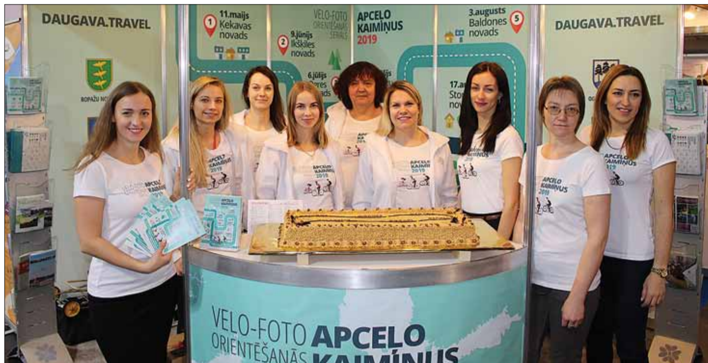
Astoņu novadu kopīgais stends starptautiskajā tūrisma izstādē-gadatirgū „Balttour 2019”.

No 1. līdz 3. februārim Ķīpsalā notika 26. starptautiskā tūrisma izstāde-gadatirgus „Balttour 2019”. Tajā piedalījās vairāk nekā 850 dalībnieku gan no Latvijas, gan citām valstīm, piedāvājot interesantākos un izdevīgākos ceļojumus un atpūtas galamērķus mūsu valstī un visā pasaulē. Izstādes laikā apmeklētāji varēja iepazīties ar šā gada jaunumiem un jau pārbaudītām vērtībām tūrisma nozarē.