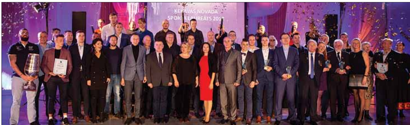
Mirkļis no Ķekavas novada sporta laureāta pasākuma.