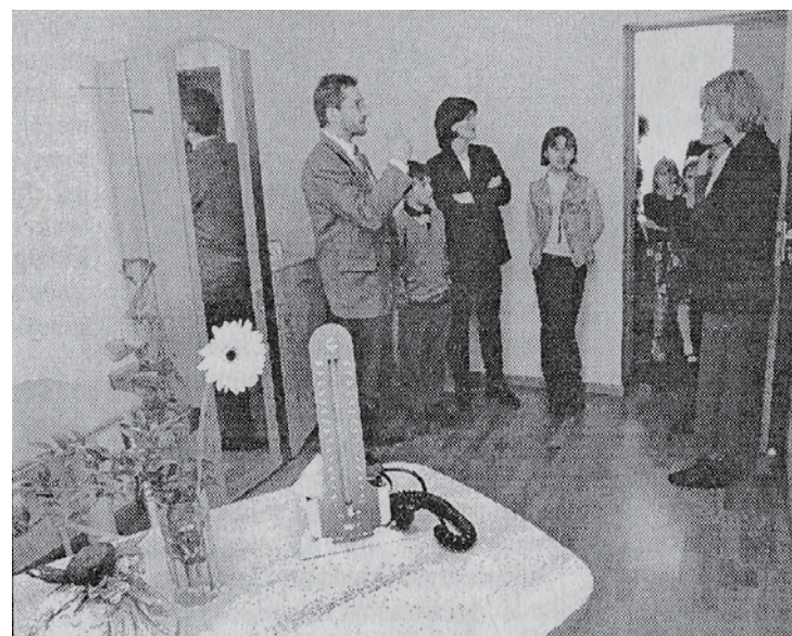
Doktorāta atvēršana 1999. gadā.