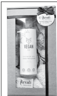
Februāra uzvarētājam dāvana gādāta sadarbībā ar salonveikalu Akcents .

Atminējumu, izgriezto no laikraksta (ne kopētu), sūtiet uz redakciju Krustvārdu mīklu konkursam, Kurzemnieks , 1905. gada ielā 19, Kuldīgā, LV-3301, vai iemetiet redakcijas vēstuli kastītē.