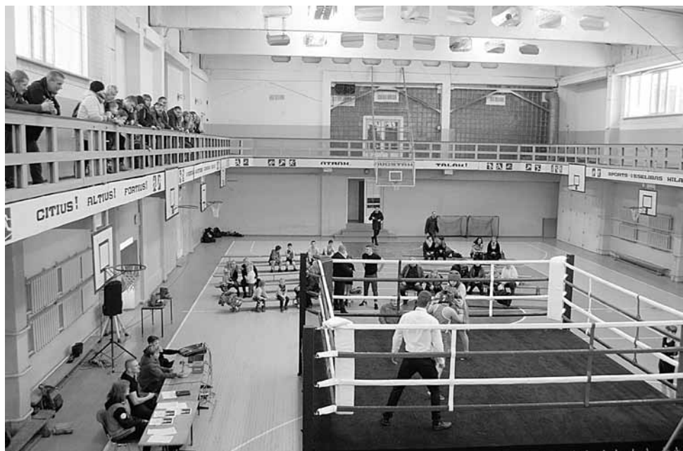
Alsungas vidusskolas sporta zālē pirmajās lielajās boksa kluba Pērkonis rīkotajās sacensībās piedalās dalībnieki no Alsungas, Liepājas un Grobiņas.