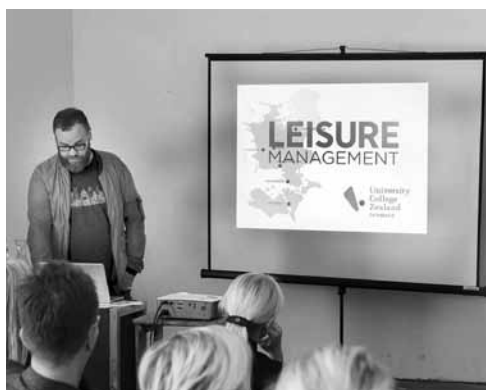
Mirklis no radošās vasaras skolas Pakalpojuma dizains. Izglītība 21. gadsimtā .

Pagājušajā vasarā rezidences zālē tika atklāta Raimonda Kalēja veidota izstāde Latvijas mākslas retrospekcija . Tās laikā tika demonstrēti video, izmantojot darbnīcu aprīkojumu. Notikušas vasaras skolas Pakalpojuma dizains. Izglītība 21. gadsimtā .