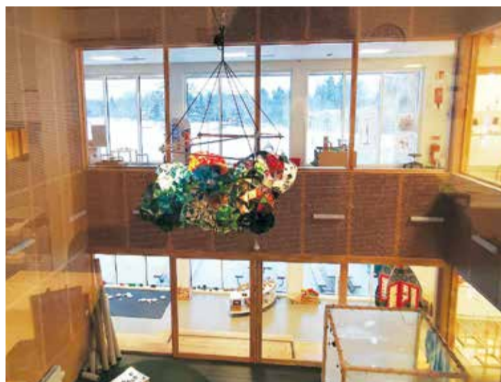
Košo, dzīvespriecīgi krāsoto lampas abažūru veidoja pašvaldības apmaksāts dizainers, un tā tapšanā piedalījās arī paši iestādes audzēkņi.