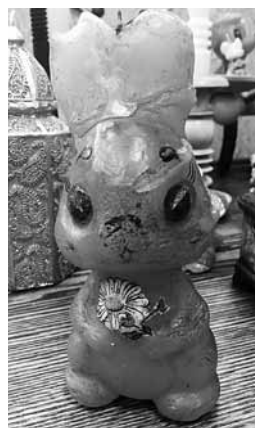
Vaska svece zaķa formā piedzīvojusi ilgu mūžu – tai ir 29 gadi.

Izstādē ir 70 eksponātu. Prieks, ka bija atsauce: ir atnesti gan pašdarināti svečturi no koka, gan veikalā pirkti, veidoti no māla un metāla, atvesti no ceļojumiem. Daži lasītāji padalījās ar stāstiem par atnesto lietu. Piemēram, vecākajai svecei zaķa formā ir 29 gadi. Vienu svečturi meistars kādam pārim taisījis kā dāvanu zelta kāzās, tāpēc prieks, ka viņi bija gatavi padalīties ar tādu vērtību. Ir īpaši mīļie svečturi mammai, vecmammai. Liels paldies visiem, kuri piedalījās izstādes veidošanā!”