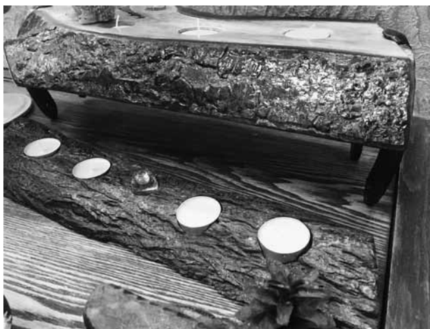
Kādam pārim pašdarināts koka svečturi uzdāvināts zelta kāzās.