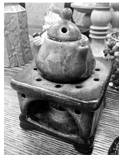
Svečturi, kuram kanniņā var ieliet ēterisko eļļu, kas, svecei degot, piepilda māju ar patīkamu aromātu.