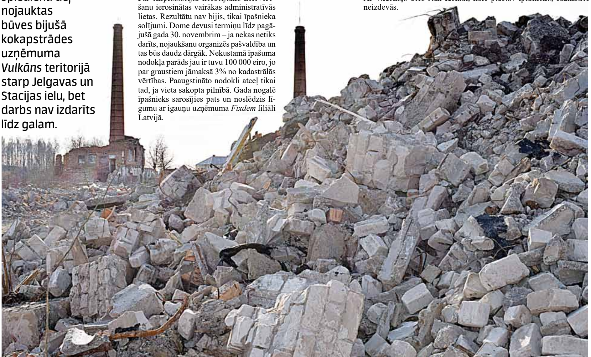
Mēneša laikā strauji nojaukti vecās rūpnīcas Vulkāns grausti, bet darbs pēkšņi apstājies un vieta joprojām bīstama. Abus lielos skursteņus atļauts atstāt kā kultūrvēsturisku rūpniecisko mantojumu.