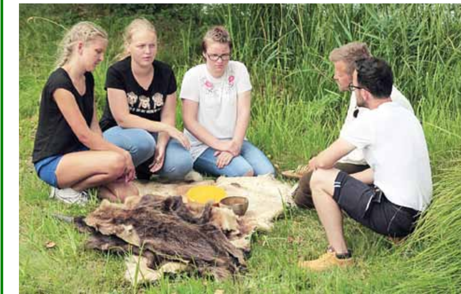
Meitenes uzklaušu, kādas neprecizitātes pieļautas un kādas izvēles bijušas pareizas uzdevumā par seno tirgošanos.

Trīs Skrundas vidusskolas meitenes pērn jūlijā piedalījušās Latvijas televīzijas raidījuma Vēstures skolotājs filmēšanā. Viņas stāsta par divu dienu ekspedīcijā pieredzēto, kad ar praktiskās arheoloģijas palīdzību bija jāatklāj Latvijas vēsture.