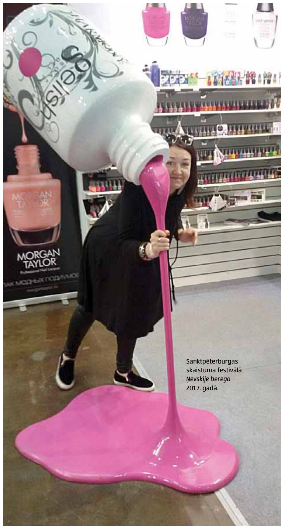
Sanktpēterburgas skaistuma festivālā Nevskiye berega 2017. gadā.