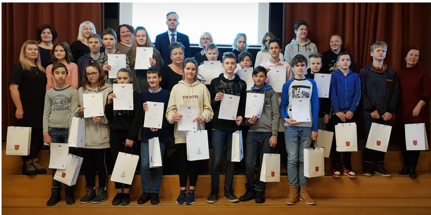
Krimuldas vidusskolā uz angļu valodas olimpiādi pulcējas apkārtnes skolu skolēni.

8. februārī Krimuldas vidusskolā jau sesto gadu pulcējās apkārtnējo novadu septīto klašu skolēni, lai demonstrētu savas zināšanas angļu valodas olimpiādē.