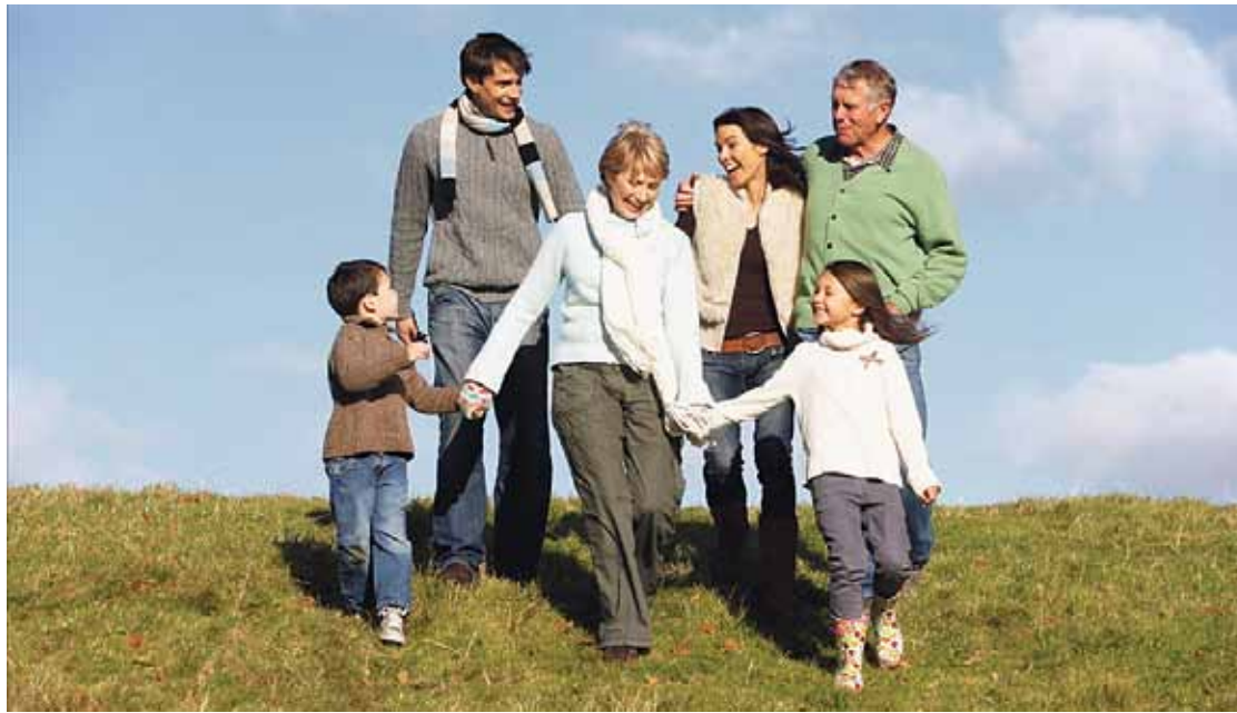
Ķekavas novada bāriņtiesa aicina kļūt par audžuģimeni, lai palīdzētu bez vecāku gādības palikušajiem bērniem atrast jaunu ģimeni.

2013. gadā audžuģimenes bija kļuvušas par mājām 1262 Latvijas bērniem, no kuriem 386 bērni tika ievietoti audžuģimenē tieši 2013. gadā. Diemžēl ne visiem bez vecāku gādības palikušajiem bērniem dažādu iemeslu dēļ ir izdevies nodrošināt piemērotus apstākļus audžuģimenē, tādēļ 603 bērni 2013. gadā ievietoti aprūpes un rehabilitācijas institūcijās. Ne-