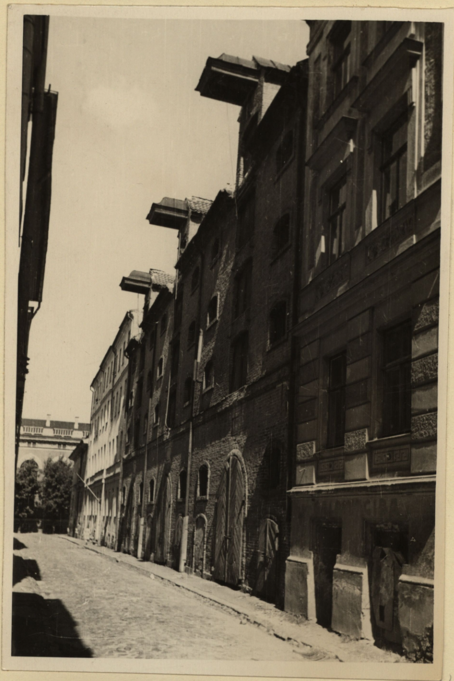
Skats uz molītavas galveno fasādi.

Molītavas Arzenāla ielā 5 /g. 8, Nr. 62/