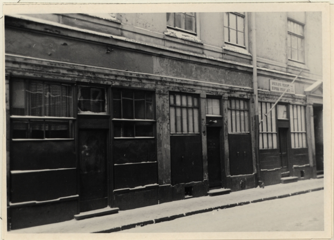
CIPARSONA FOTO 1958.G.I