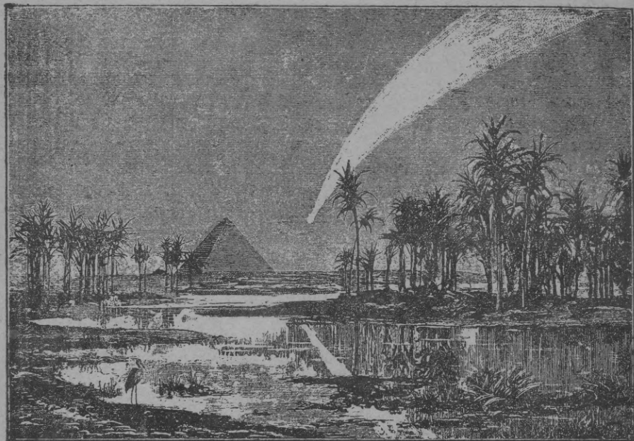
Sihm. 1. 1858. gada (Donati) kometaš iškats.

nekad ihstēni neisnīdētās bailes pamosās no jauna. Kometa pē debesīm — pasaulei gals klāt! Un, pateesību šakot, sinatne arī noteiktu atbildi uz šo „breesmigo“ jautājumu nedod. Wina tikai noleeds, ka kometa waretu paregot nahfoschās nelaimēs. Sinatne wispahri neatīhst nekahdas tamlihdfigas nepamatotas pra-