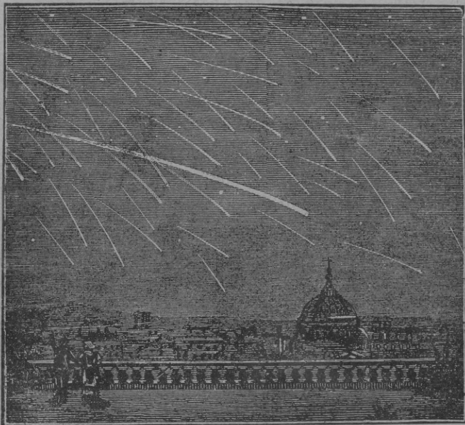
Šihm. 2. „Šwaigšņu leetus“ 1872. g. Meteoritu krišana.

Keplera laikeem tā ween līdās, ka astronomija šķemīgi atrīnās šo jautajumu. Kad bij iššķirts jautajums par debēs parahdibu absoluto noteiktību, neatlīdās preešch debēs atmeņem wairš we e t a s, bet luxi tomehr . . . leelā škaitā nahža kļah no debēs išplatījuma. Dāšchi finatnes „ištee“ preešchstahwi nu nehmas apgalwot, ka tahdu atmeņu nemaš neefot. Parišes Akadēmija 18. gadušimteni išjoboja katru, kas bij nehmis to pahdrošchibu teitt, ka no debesim krihtot meteoru atmeni... Bet debēs parahdibu pateefais šakars bij stiprats par Parišes gudro akadēmiku asprahtibam. Atmeni krita un nokrita uš dabas pehtneeka galda. Šlgat teeptes nebij wairš eespehjams un nu ari atfina, ka uš jemi krihtot daudš masu ķermenišchu; weena daļa no teem šadegot at-