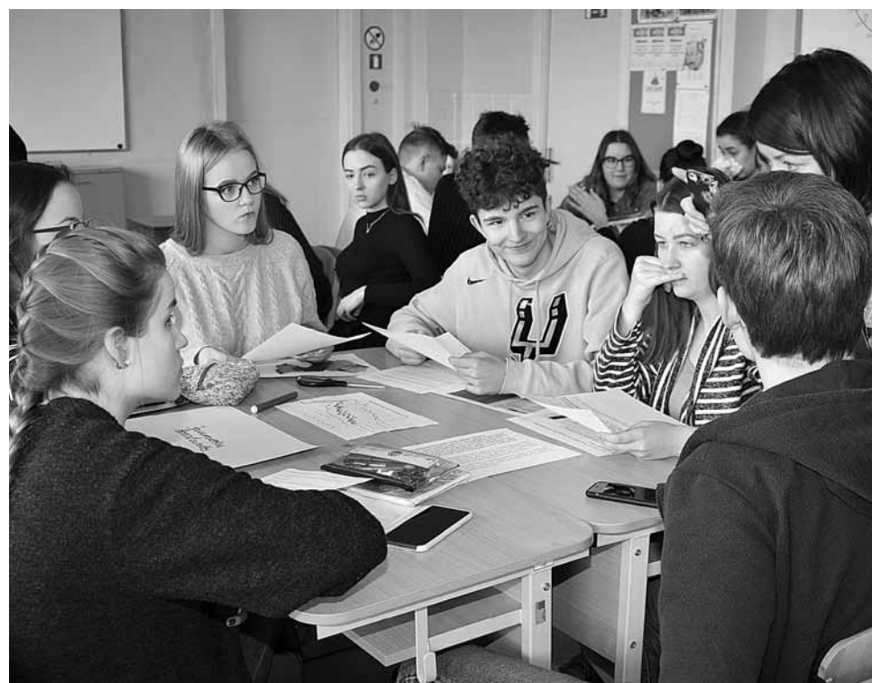
Kuldīgas Centra vidusskolas 11. klases skolēni atklātajā stundā programmā Eiropas Parlamenta Vēstnieku skola veido plakātus un izsaka priekšlikumus, kurus varētu iesniegt Eiropas Parlamenta deputātiem.