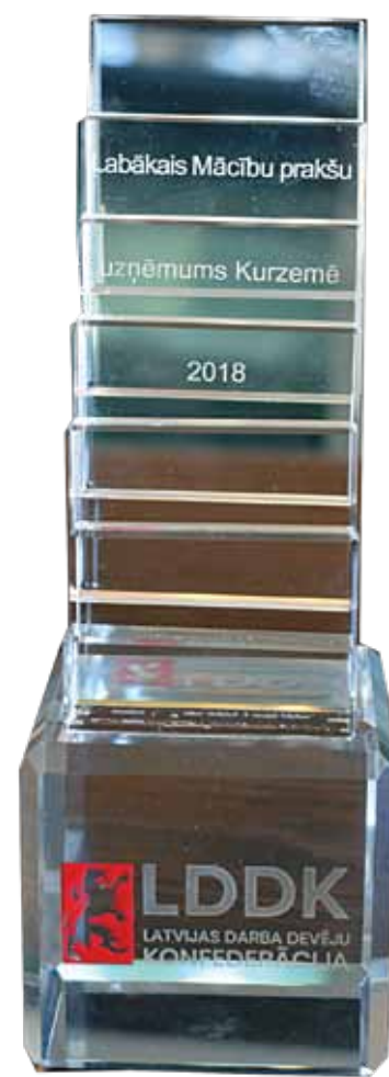
Antra Grīnberga