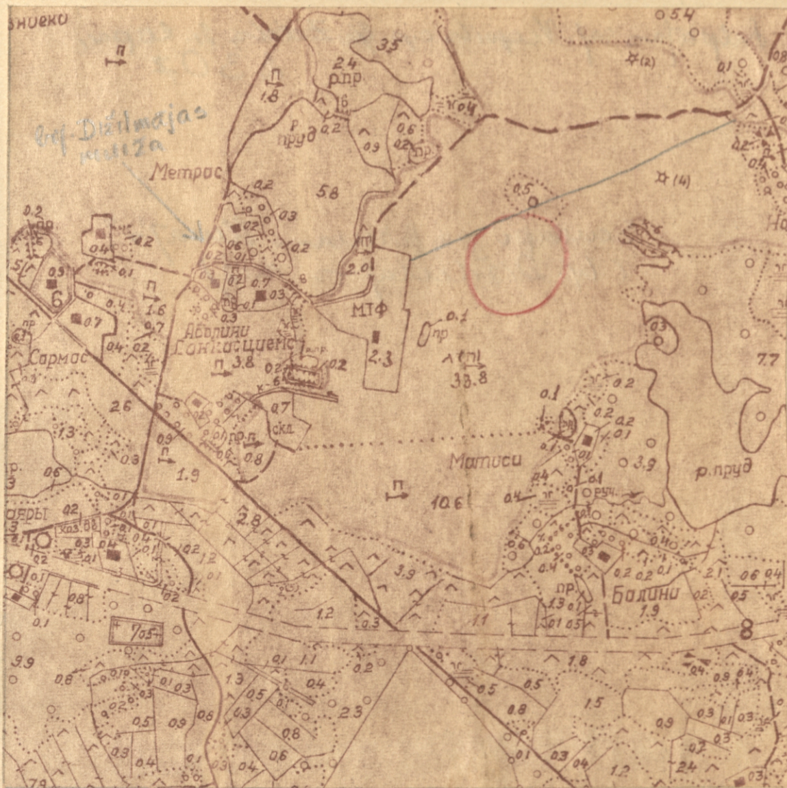
Senkapi pie fermas "Ilmāja" (bij. Dižilmājas mž.)