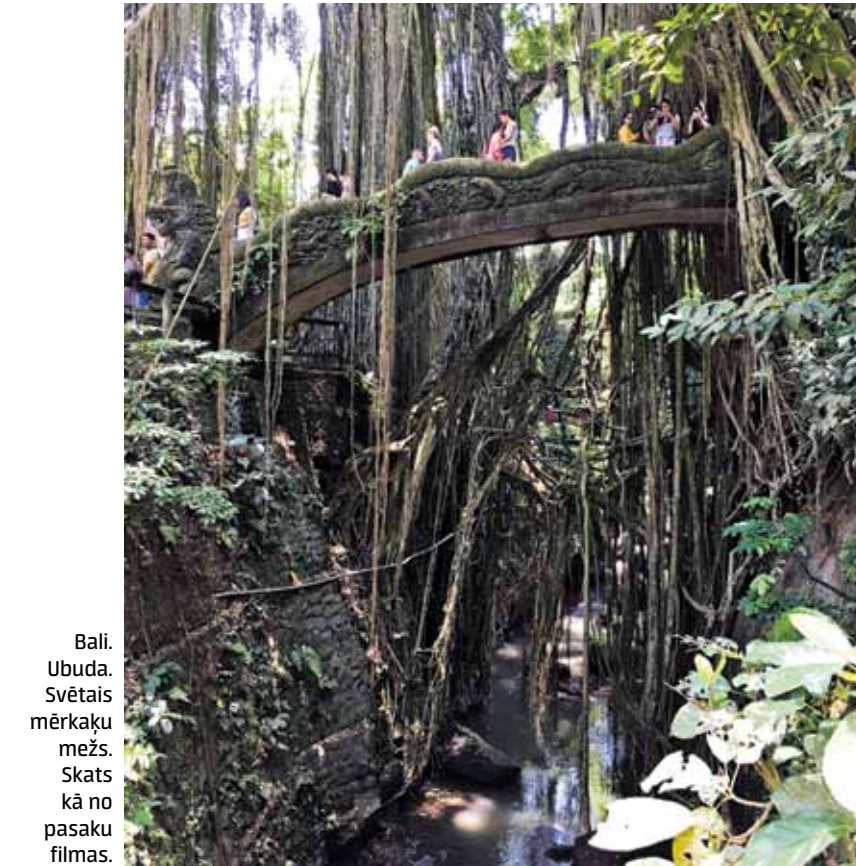
Bali. Ubuda. Svētais mērķaķu mežs. Skats kā no pasaku filmas.

Izkāpjot no taksometra, apņem patīkams karstums un salda, tikai Bali raksturīga smarža, kas pārāpēm plūst no dzeltenīgi bal-tajiem fragiņiem ziedieniem. Mājas atrodas slēgtā, skaisti sakoptā teritorijā. Ieraugot savu mājiņu, mazliet samulstam. Tā ir milzīga, divstāvēģa māja ar plašu vestibulu pirmajā stāvā un baseinu gandrīz pie pašām durvīm. Apstādījumos skaļu mīlas dziesmu dzied maza, zaļa vardīte, un netālu zāgē cikākad ēdiena vietā mums iedod plastmasas diskus. Izrādās, ka brīni-liski sadzīvo ar vēsturiskajām ekām un tempļiem. Līdz ar tumsu