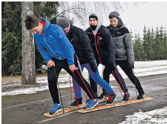
Brikuļi atzīst, ka slēpošanā ar dēļiem visvairāk zaudējuši laiku.

12 pieturvietās dažādi uzdevumi prasīja attapību, sa-