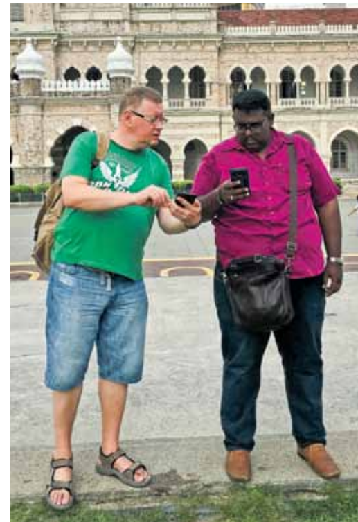
Antras Dilānes teksts un foto (Turpmāk vēl.)

Tālāk ceļš ved uz Indonēzijas paradīzes salu – uz Bali. Divu stundu pārlidojumam izmantojam Āzijas aviokompāniju AirAsia , biļetes esam nopirkuši jau iepriekš. Kamēr to gaidām, ieturam skaļu mīlas dziesmu dzied maza, zaļa vardīte, un netālu zāgē cikākad ēdiena vietā mums iedod plastmasas diskus. Izrādās, ka brīni-liski sadzīvo ar vēsturiskajām ekām un tempļiem. Līdz ar tumsu