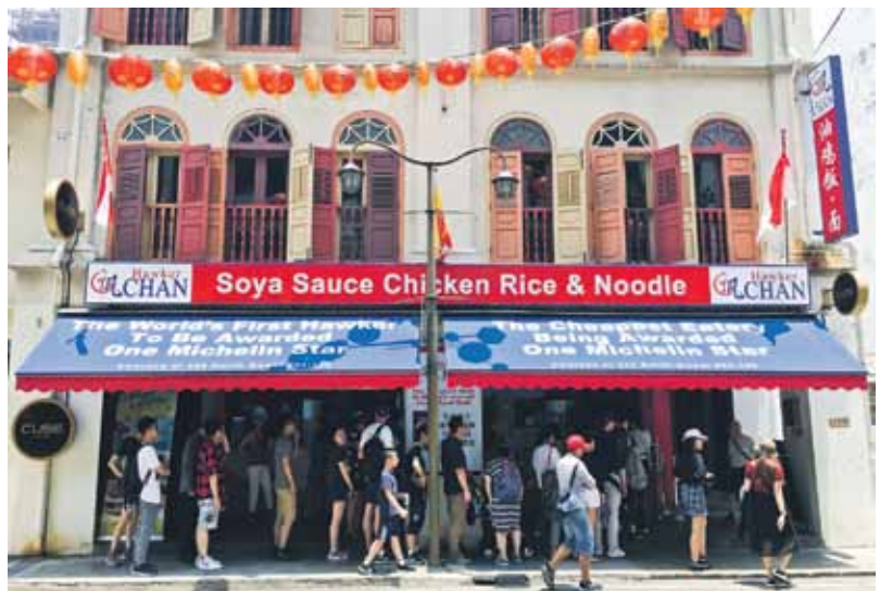
Singapūra. Ķīniešu kvartāls. Lētākais Michelin zvaigzni ieguvušais restorāns pasaulē.