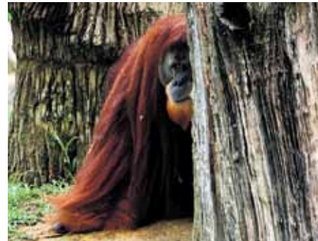
Singapūras zoodārzs. Orangutanu boss.

Pilsēta ir apskates vērtā: debesskrāpi un modernās celtnes ļaunu nenojauzdami, mierīgi gul, bet mēs ar šo puisī vadām autobu-