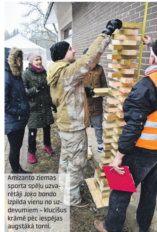
Amizanto ziemas sporta spēļu uzvarētāji Joķa banda izpilda vienu no uzdevumiem – kuciņš krāmē pēc iespējas augstākā tornī.