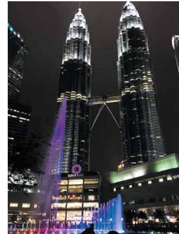
Malaizija. Kualalumpura. Petronas dvīņu torni.