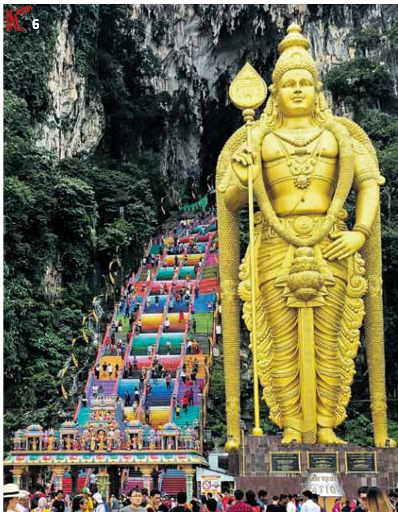
Malaizija. Hindu svētvieta – Batu alas.