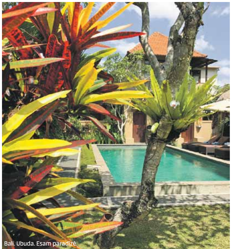
Bali. Ubuda. Esam paradīzē.

Ceļošana mums ir kā piedzīvojums, izraušanās no ierastā ritma, atpūta no darba un ikdienas pienākumiem. Āziju esam iemilējuši no pirmās tikšanās reizes. Tā ir tik skaista savā dažādībā, ka gribas to iepazīt, izgaršot un izbaudīt. Katru reizi pa mazam gabaliņam, visbeidzot saliekot to visu vienā lielā un krāšņā mozaikā. Priekšroku dodam pašu plānotiem ceļojumiem. Tas sniedz vairāk brīvības un iespēju izvēlēties sev tīkamu ceļojuma maršrutu. Nav mazsvarīgs arī fakts, ka šādi ceļot ir lētāk.