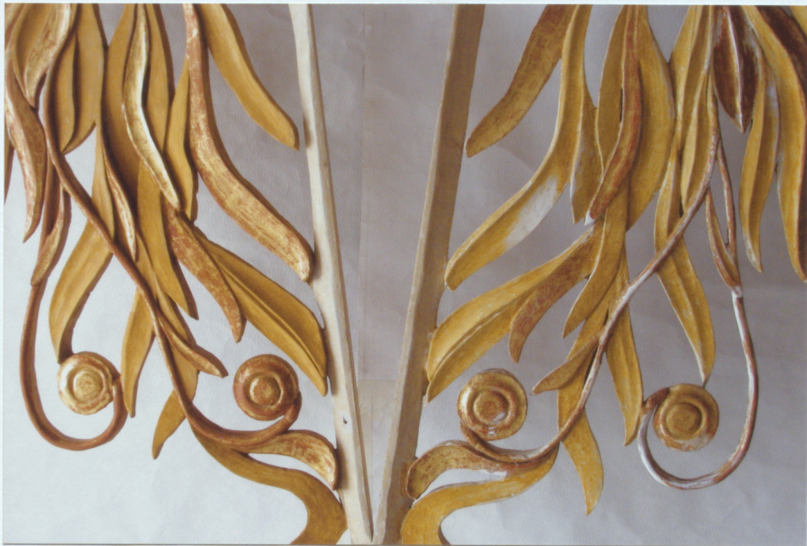
15. Prospekta "spārnu" fragmenti pēc pārkrāsojumu noņemšanas