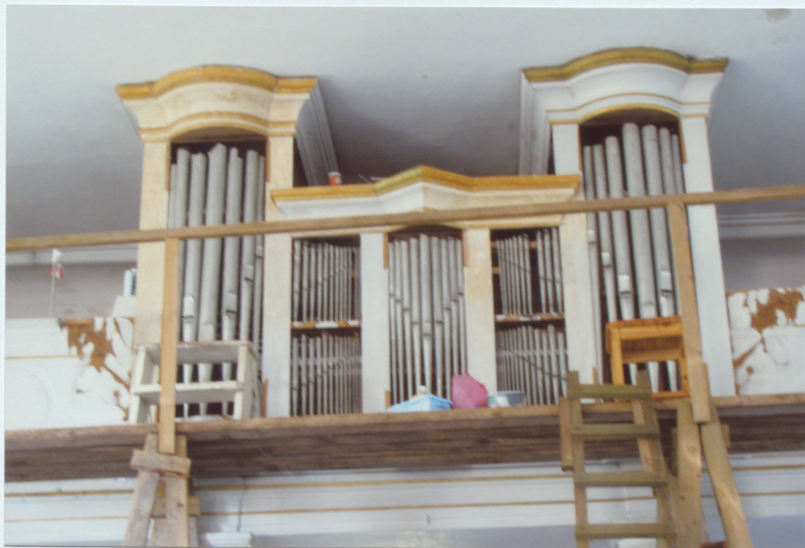
3. Karkasam daļēji noņemti pārkrāsojumi, atsedzas siltāki baltais krāsojums