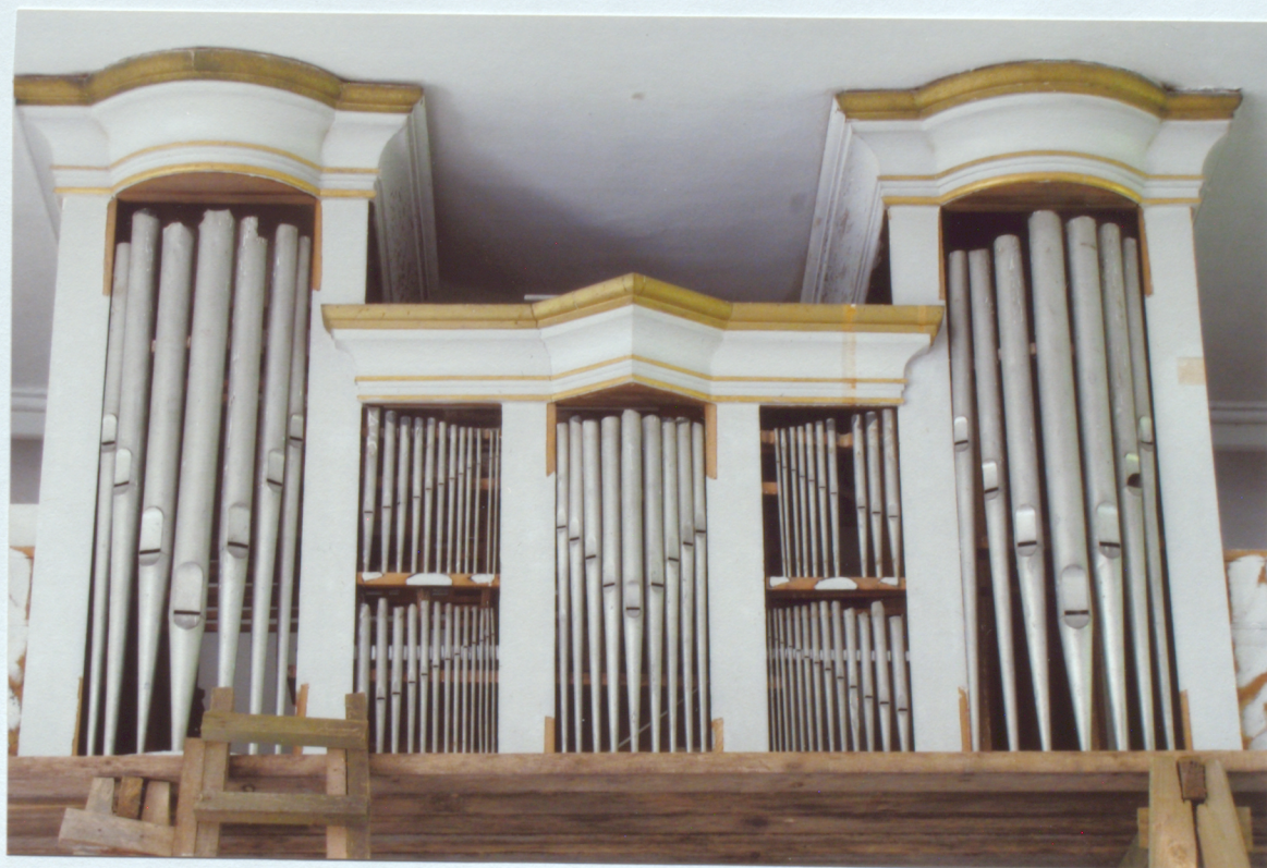
2. Prospekta karkass; pēc kokgriezumu demontāžas