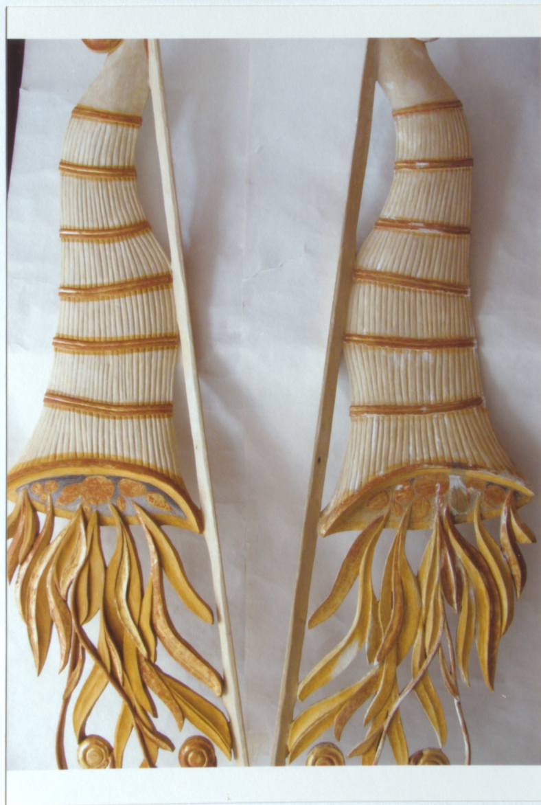
18. Prospekta "spārni"; kreisajā pusē- veikta krāsojumu zudumu retuša; labajā pusē-pēc grunts zudumu ieklāšanas