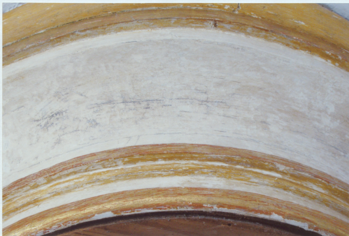
7. Kreisā stabu loga dzegas fragments pēc pārkrāsojumu noņemšanas