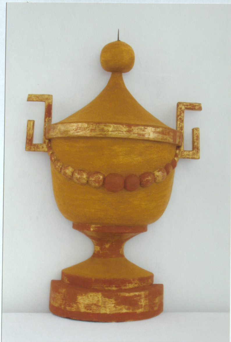
20. Prospekta frontona vāze pēc krāsojumu zudumu retušas; pirms zeltījumu zudumu retušas