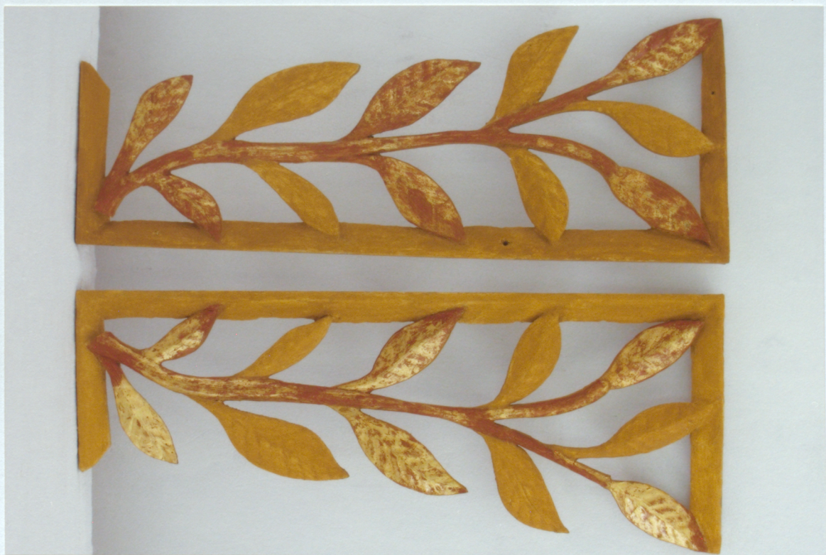
14. Stabuļu logu terna kokgriezumi pēc krāsojumu zudumu retušas