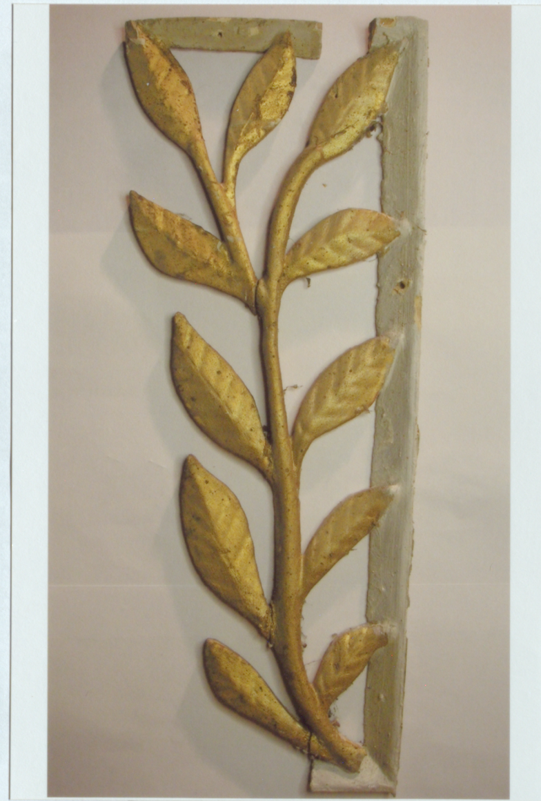
10. Centrālās daļas stabuļu loga kokgriezums pirms restaurācijas