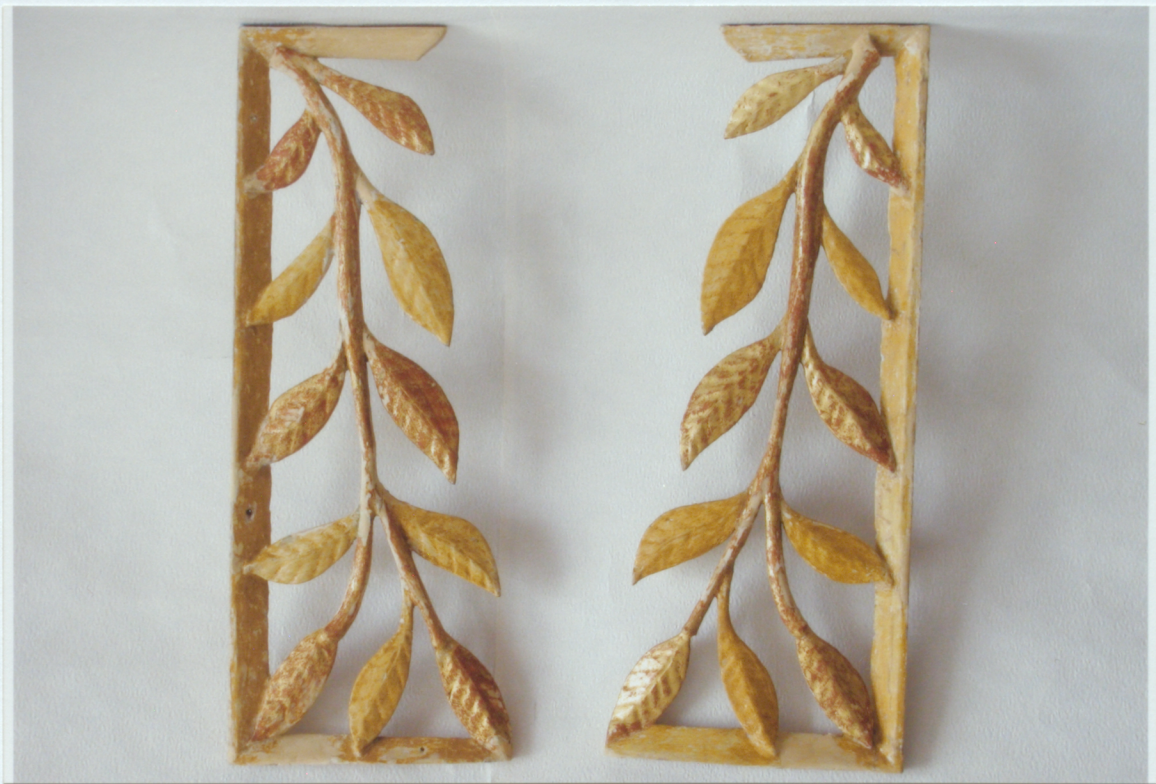
13. Stabuļu logu kokgriezumi pēc pārkrāsojumu noņemšanas