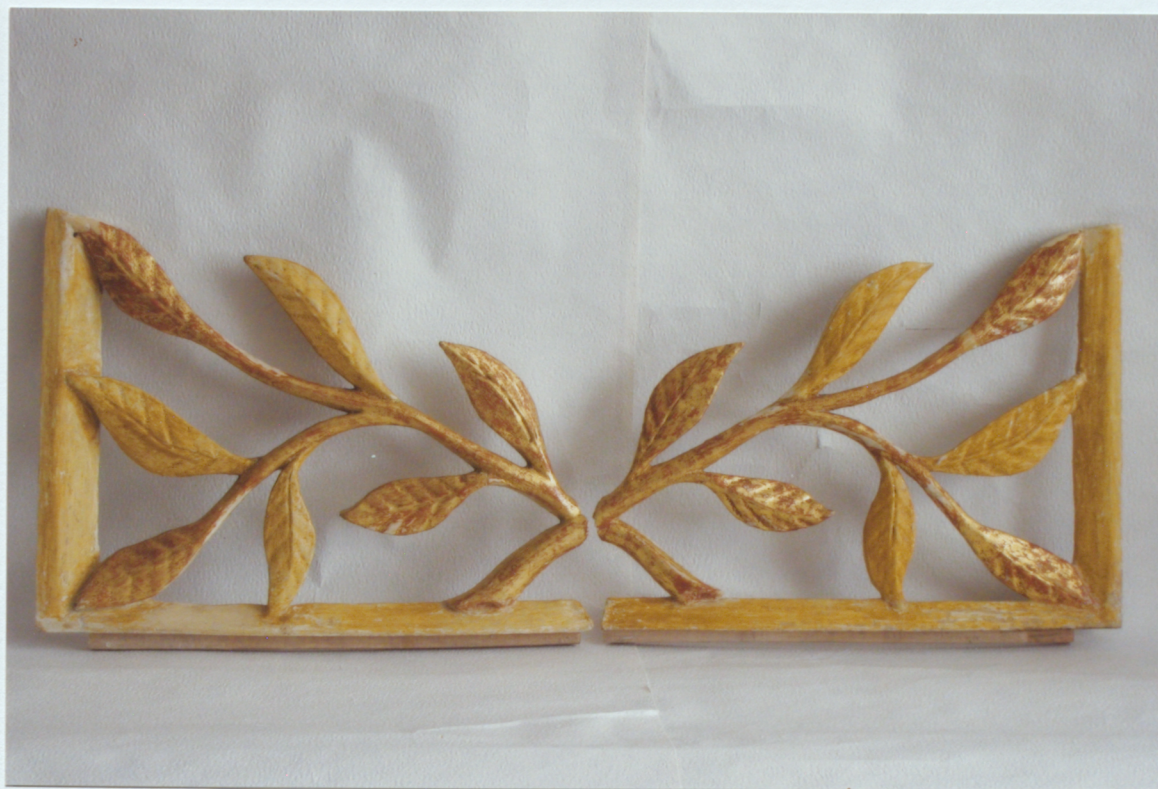
11. Centrālās daļas apakšējais kokgriezums pēc pārkrāsojumu noņemšanas