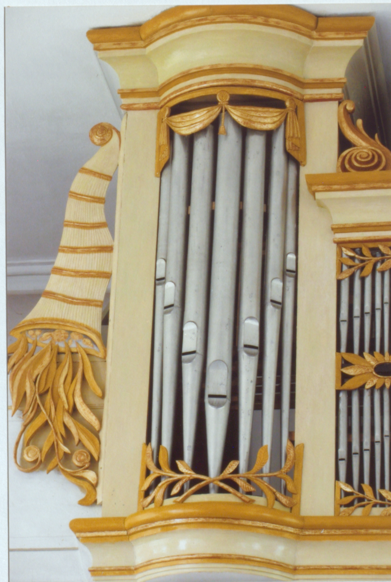
19. Kreisais stabuļu tornis un "spārns"- pēc restaurācijas