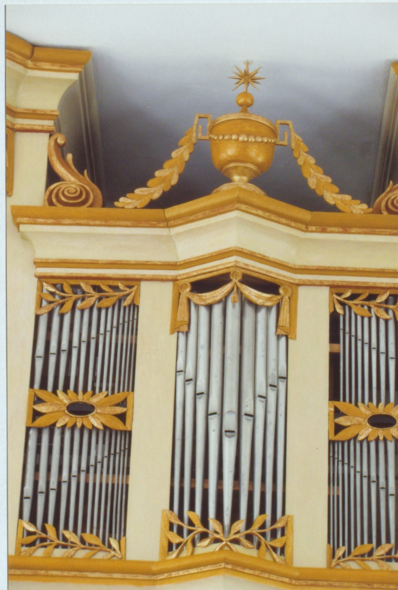
21. Prospekta centrālā daļa pēc restaurācijas