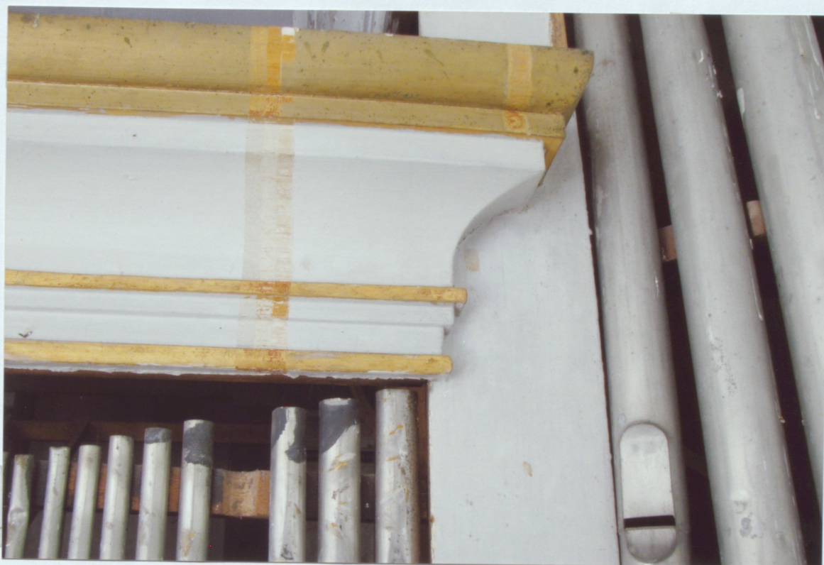
5. Krāsojumu slāņu zondāžas uz centrālā stabuļu loga dzegas