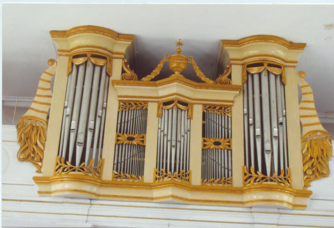
4. Prospekta kopskats pēc restaurācijas