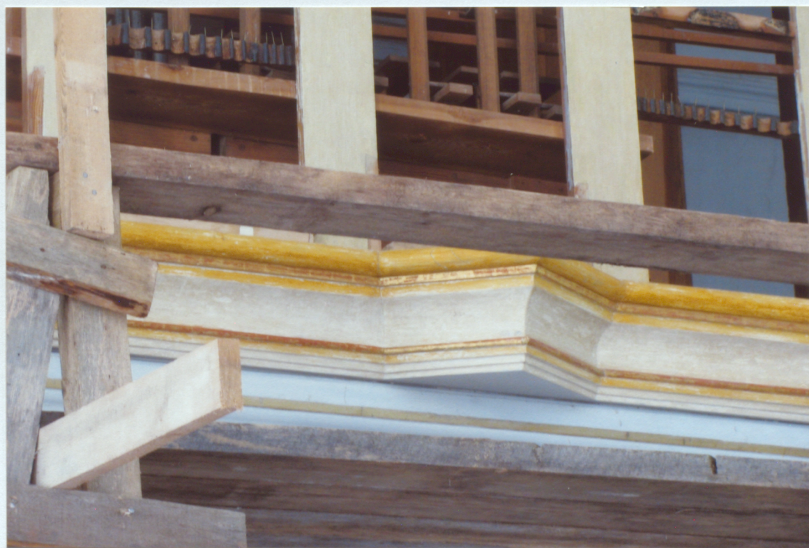
8. Cokola dzegas centrālā daļa- pēc pārkrāsojumu noņemšanas