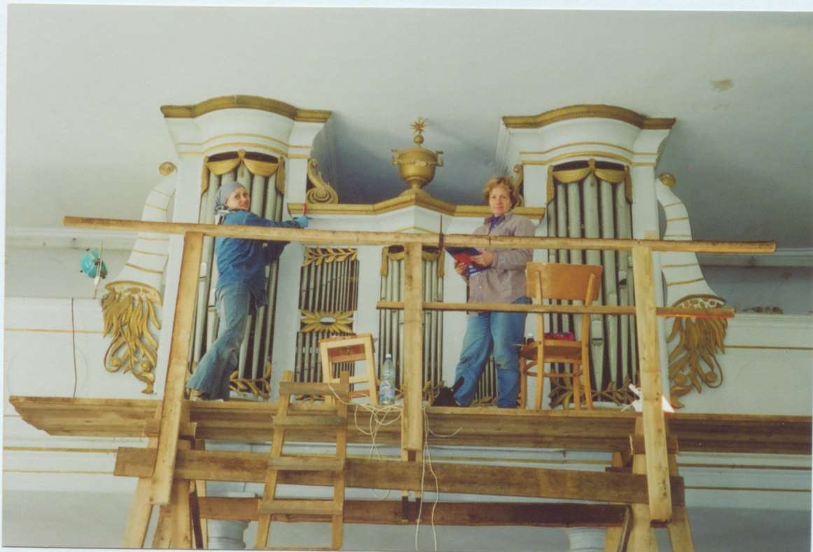
1. Prospekta kopskats- izpētes procesa laikā