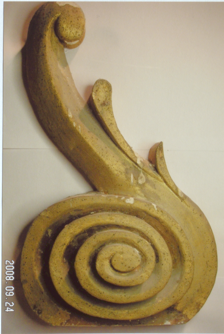
9. Centrālās daļas frontona kokgriezums pirms restaurācijas