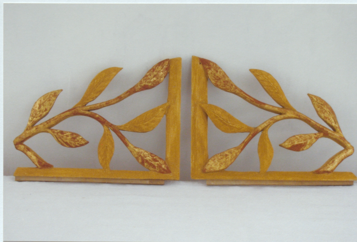
12. Centrālās daļas apakšējais kokgriezums pēc krāsojumu zudumu retušas