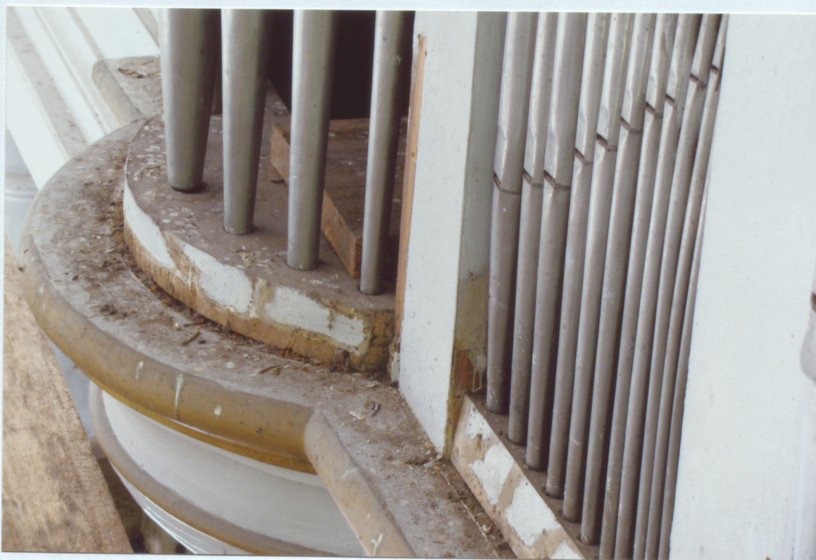
6. Cokola dzega- pirms restaurācijas