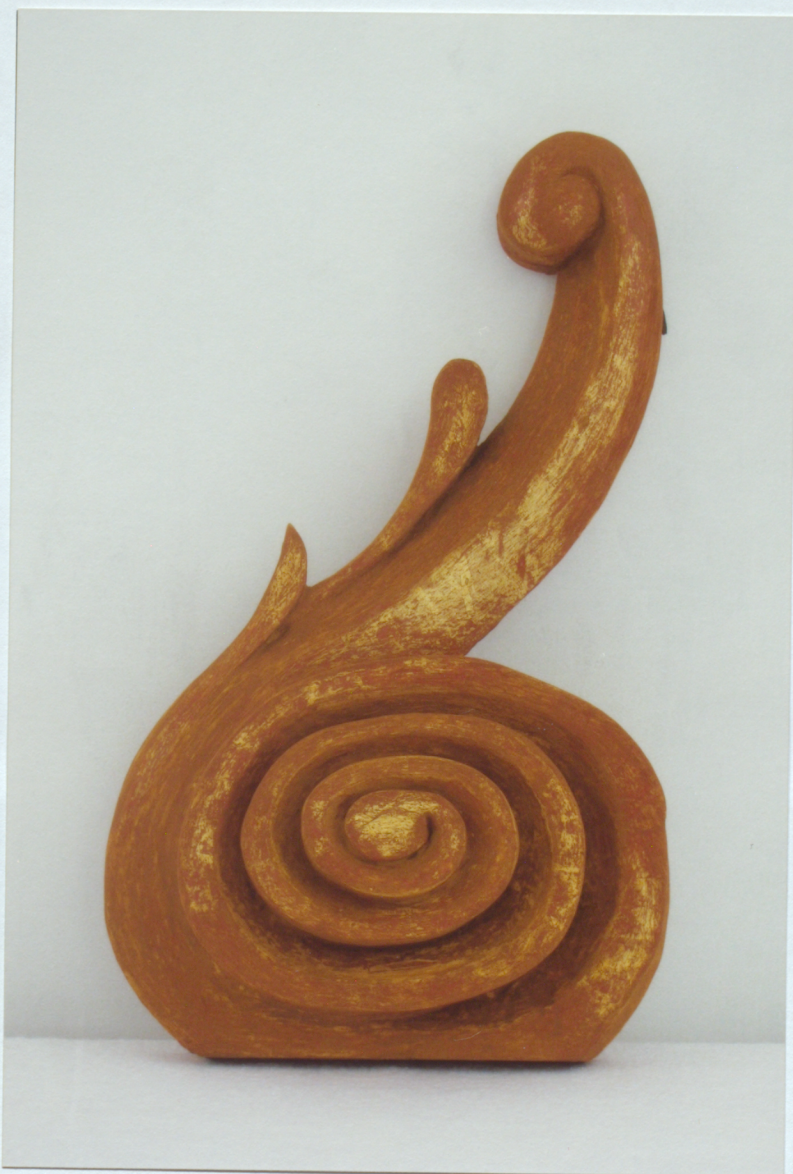
17. Centrālās daļas frontona kokgriezums pēc pārkrāsojumu noņemšanas;gruts zudumu ieklāšanas; krāsojumu retušas; pirms zeltījuma retušas.