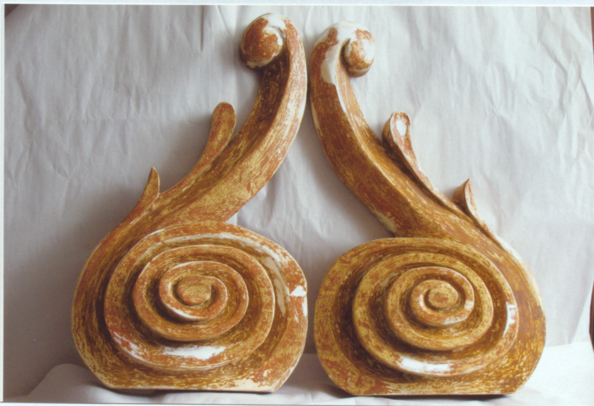
16. Centrālās daļas frontona kokgriezumi pēc pārkrāsojumu noņemšanas un grunts zudumu ieklāšanas