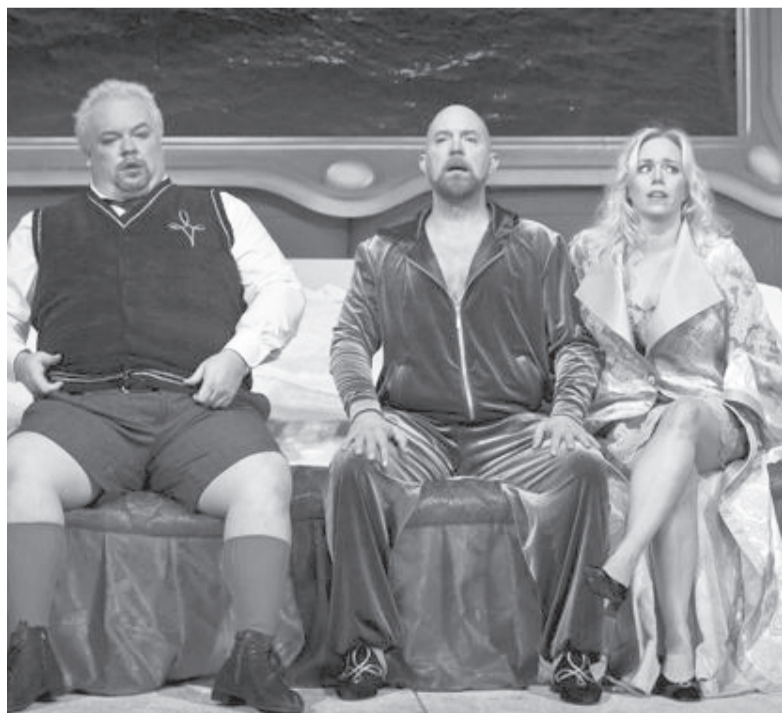
Skats no operas "Dievu mijkrēslis" izrādes Rīgā