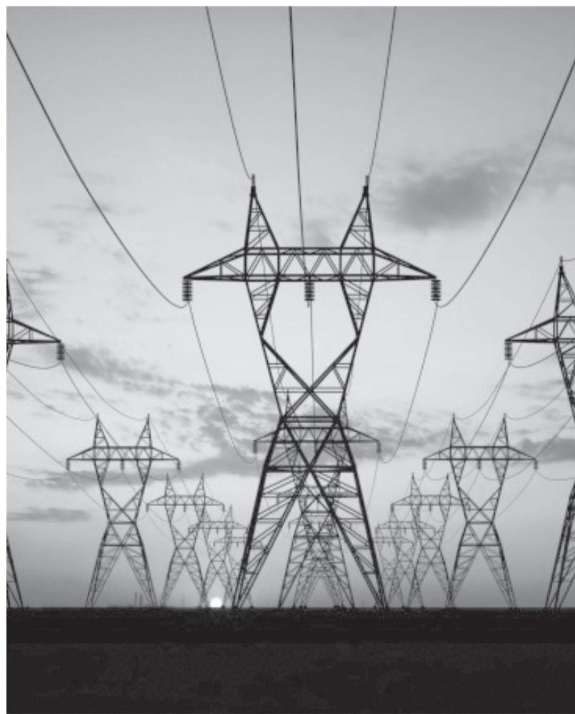
Fragments no I. Jurjānes veidotā izrādes plakāta