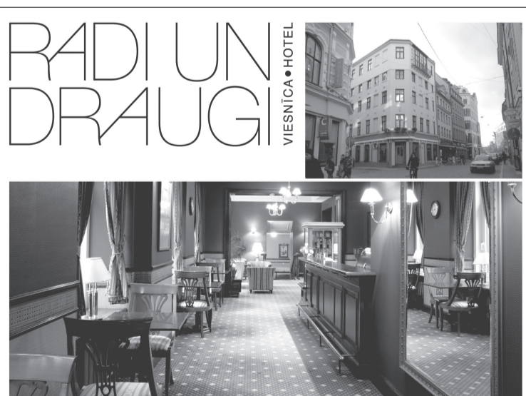
VIESNĪCA "RADI UN DRAUGI" - JŪSU VIESNĪCA RĪGĀ! 72 labiekārtotas un mājīgas istabas (cena no 51EUR) / Bagātīgas brokastis iekļautas viesnīcas cenā / Konferenču zāle / Autostāvieta Vecrīgas centrā

Mārstāja iela 1, Rīga, LV1050, Latvija T:+371 67820200 F:+371 67820202 E: radi.reservations@draugi.lv www.draugi.lv