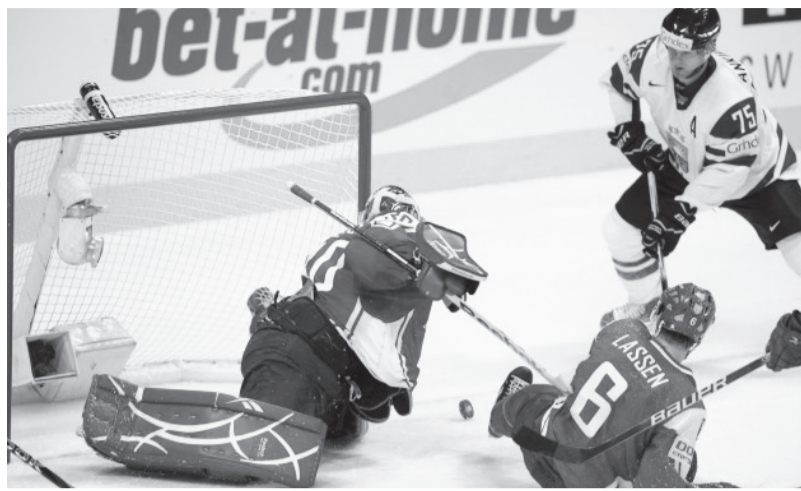
Latvijas un Dānijas hokejistu spēle pasaules meistarsacīkstēs

Latvijas hokeja izlase pārstāv Latviju starptautiskajās hokeja spēlēs. Šīgada pasaules meistarsacīkstēs vienība izcīnīja 12. vietu. Izlase pie-