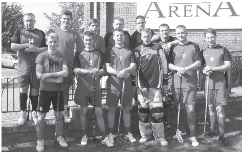
Mansfildas florbola vienība