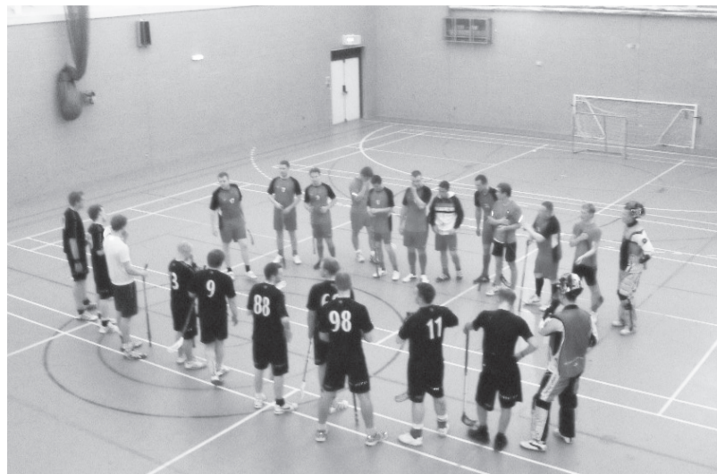
Tūlīt sāksies spēle starp Mansfildas un Notinghamas vienībām