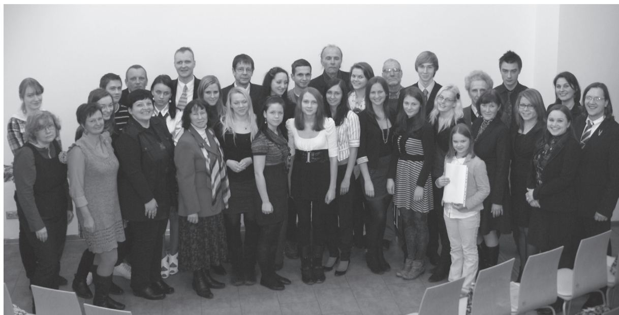
Literārā konkursa uzvarētāji, viņu skolotāji, žūrijas pārstāvji un viesi

Vēl žūrijas komisijas locekles izteicās, ka būtu ļoti jauki, ja jaunieši, uzsvērdami nacionālos jautājumus kā ļoti nozīmīgus, īpaši akcentējot mūsu nacionālās identitātes pamatvērtību – latviešu valodu –, pievērstu nedaudz vairāk uzmanības saviem izteiksmes līdzekļiem, cenšoties nepieļaut gramatikas, interpunkcijas un stila kļūdas. Skumdina studējošo un ārvalstīs dzīvojošo jauniešu aktivitātes trūkums – katrā no šīm kategorijām tika iesūtīts pa vienam darbam. Toties